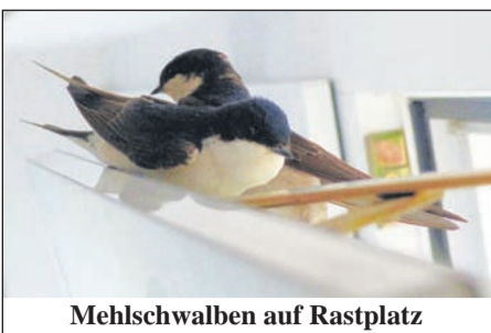
Mehlschwalben auf Rastplatz

Daß es auch in Radeberg Wohnungssuchende aus Afrika geben wird, hatte uns der OB ja schon angekündigt. Doch daß eben diese - statt von der Wohnbau mit einer Zuweisung an die Tür klopfen - sich völlig unangemeldet gleich innen auf der Fensterkante niederlassen! Was soll's, wenigstens haben sie uns zum Empfang mit einem netten Zwitscherlü begrüßt. Mal sehen, was daraus wird.