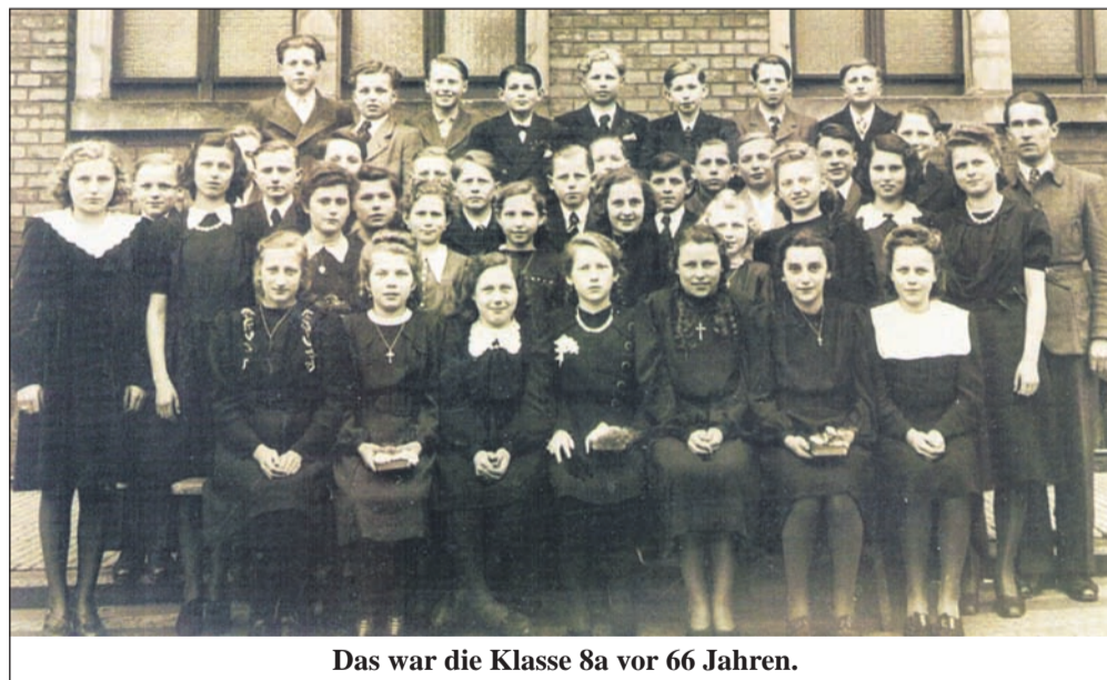
Das war die Klasse 8a vor 66 Jahren.