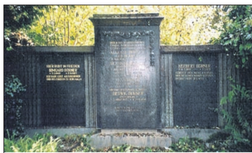
Grabmal der Familie Börner, ca. 1990

Eine Radeberger Begebenheit um das Jahr 1925 von Renate Schönfuß-Krause