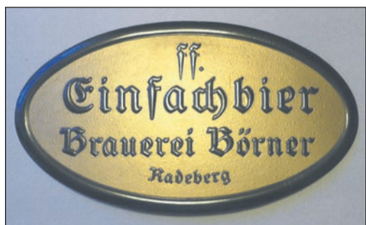
Gaststättenschild Brauerei Börner, ca. 1920; Hersteller: Plakatfabrik Dresden-Laubegast