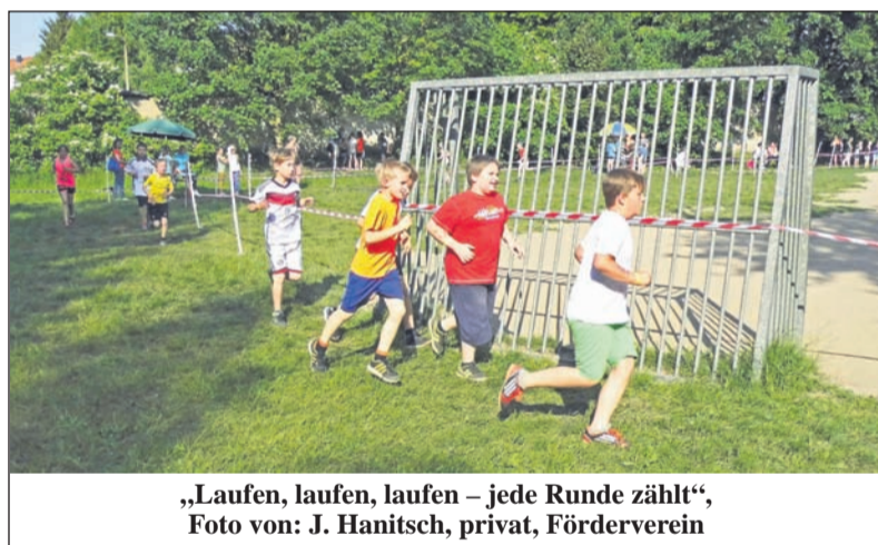
„Laufen, laufen, laufen – jede Runde zählt“

Am 3. Juni war es soweit, „der 2. Sponsorenlauf“ des Fördervereins der Grundschule Süd in Radeberg e.V. 153 Kinder liefen für den guten Zweck einer „Coolen Schule“ 2333 Runden. Circa 750 Besucher feuerten sie dazu an. Eine handgefertigte Medaille und ein Freigetränk war die Belohnung. An 13 Ständen war zu dem was los. Schminken & Hüpfburg sowie die verschiedenen Stände der Ganztagsangebote der Schule wurden von Jung & Alt gut angenommen. Hinzu kam ein kleines Show-Programm aus dem Bereich Keyboard, Singen und Tanzen, das einen großen Zuspruch hatte. Anlässlich dieser Veranstaltung bekam der Förderverein vom Vorsitzenden des Kohlraabi-Insellverein e.V. Herrn Lafeld einen Scheck in Höhe von 300 EUR überreicht. Da der Förderverein tatkräftig