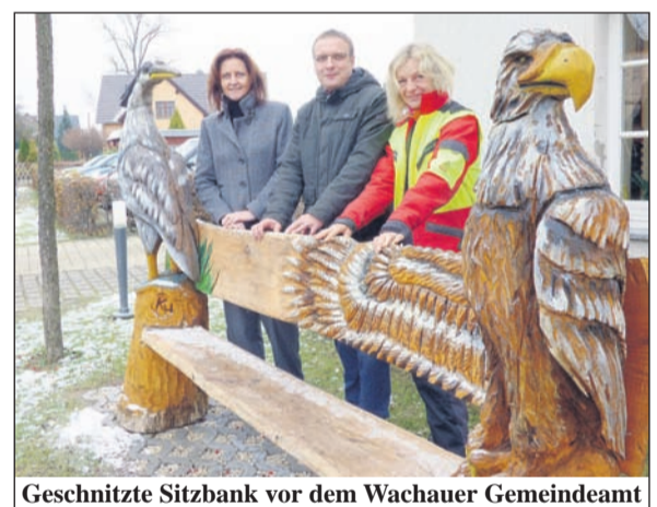
Geschnitzte Sitzbank vor dem Wachauer Gemeindeamt