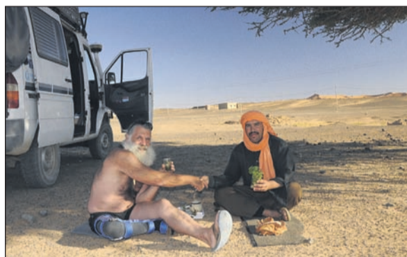
Auch wir haben mit Einheimischen gleich den Berberwhisky neben unserem Auto getrunken.

Marrakech oder den unendlich vielen kleinen Souks in den Dörfern. Hier erlebt man allorts immer noch das typische Marokko mit seinen freundlichen Landsleuten, den geschäftstüchtigen Händlern, den Kleinhandwerker als Wanderschmied, den Schuster, den Schneider oder den Fleischer, welcher vom Ochsen übers Schaf bis zum Huhn alles gleich vor Ort auf dem Souk schlachtet,