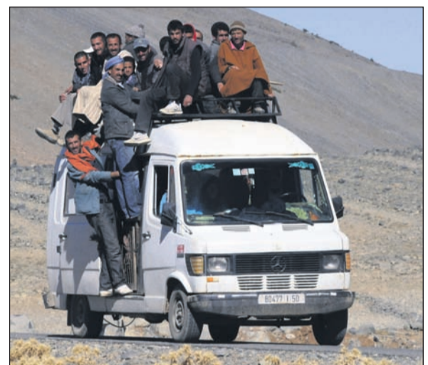
Was in einen 5-Meter-Bus (für 7 Personen in Deutschland zugelassen) nicht rein passt, kommt aufs Dach und was dort nicht mehr drauf passt, hängt sich außen dran. Auf diese Weise passen "in" den Bus nebst einigen Tieren, reichlich Gepäck noch 26 erwachsene Personen. Das ist ein wahrer marokkanischer Lastenesel auf vier Rädern.

zerteilt und verkauft. Oft in unmittelbarer Nähe steht ein Beduinenzelt, vor welchem im Lagerfeuer mehrere Kessel heißes Wasser bereit stehen. Dies ist immer ein untrügliches Zeichen dafür, hier gibt es den "Berberwhisky", bei welchem die Händler dann um die Preise feilschen oder sich einfach nur unterhalten. Nun ja - Berberwhisky ist natürlich kein Alkohol sondern ein süßer schwarzer Tee, in welchen frische grüne Minze getaucht wird. Übrigens Stichwort Alkohol - offiziell gibt es in den Geschäften keinen Alkohol zu kaufen. Selbst, so hat man uns erklärt, aus den Supermärkten wurde er wieder aus dem Sortiment gestrichen und man findet maximal alkoholfreies Bier. Allerdings bei einem