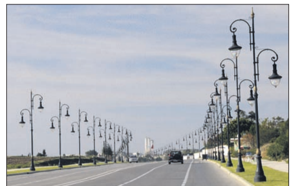
Modern ausgebaute Straßen in der alten/neuen Hafenstadt Tanger.