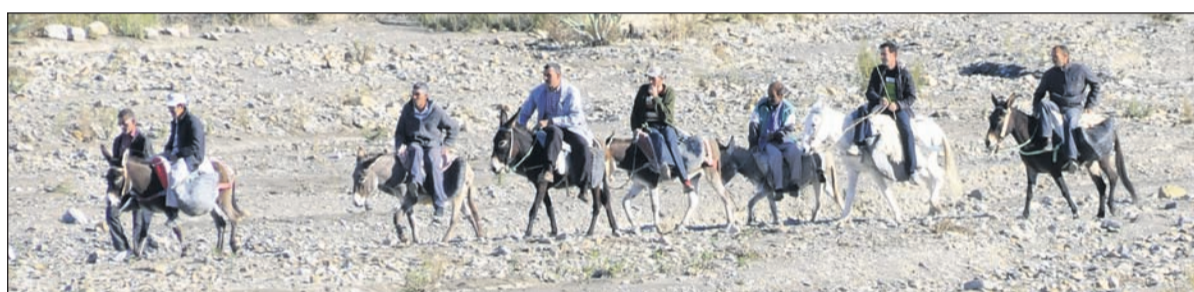
Der Esel ist immer noch überall anzutreffen, ob als Reit- oder Lastentier.

zerteilt und verkauft. Oft in unmittelbarer Nähe steht ein Beduinenzelt, vor welchem im Lagerfeuer mehrere Kessel heißes Wasser bereit stehen. Dies ist immer ein untrügliches Zeichen dafür, hier gibt es den "Berberwhisky", bei welchem die Händler dann um die Preise feilschen oder sich einfach nur unterhalten. Nun ja - Berberwhisky ist natürlich kein Alkohol sondern ein süßer schwarzer Tee, in welchen frische grüne Minze getaucht wird. Übrigens Stichwort Alkohol - offiziell gibt es in den Geschäften keinen Alkohol zu kaufen. Selbst, so hat man uns erklärt, aus den Supermärkten wurde er wieder aus dem Sortiment gestrichen und man findet maximal alkoholfreies Bier. Allerdings bei einem