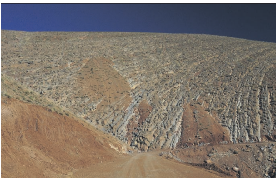
In den Bergen des Hohen Atlas findet man allorts interessante, farbige Felsformationen und nicht selten auch Fossilien.

Eindruck erhalten, Marokko hätte bei all der Modernisierung seine alten Traditionen vergessen - dem ist bei weitem nicht so. Die Marokkaner sind sich ihrer Traditionen sehr wohl bewußt. Ob von den Moscheen über Kasbahs bis hin zu dem riesigen Souk in