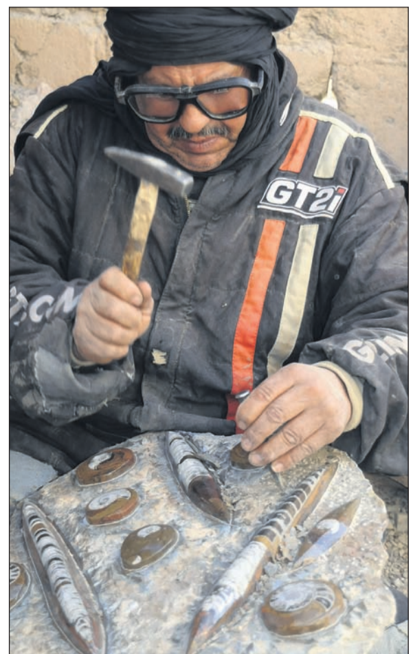
In mühsamer Kleinarbeit werden nur mit Hammer und Meißel die Fossilien aus den Felsplatten heraus gearbeitet.