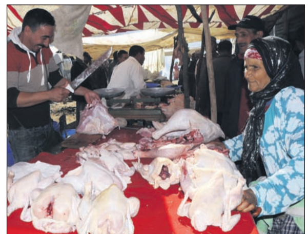
Fleischereistand ohne Kühlanlage auf dem Souk, aber garantiert schlachtfresh.