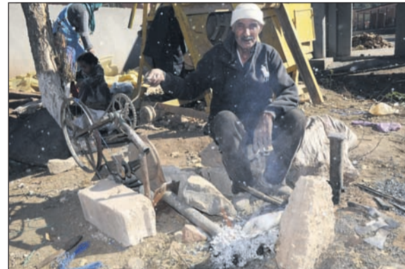
Das Schmiedefeuher wird mit einem, zum Gebläse umgebauten, Fahrrad angetrieben.