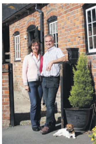
Häuser kommen in die Jahre - häufig muss dann an der einen oder anderen Stelle saniert und repariert werden.

Ältere Häuser sind in Sachen Dämmung oder Heizung oft nicht mehr auf dem neuesten Stand, häufig muss auch einfach nur an der einen oder anderen Stelle saniert und repariert werden. Und viele Menschen wollen oder müssen ihr Haus altersgerecht umgestalten. Egal was nötig ist - es geht ins Geld. "Generell sollte man sich frühzeitig Gedanken machen, wie man Renovierungsmaßnahmen oder etwa altersgerechte Umbauten finanzieren will", raten die Experten der Deutschen Vermögensberatung (DVAG). Am besten sei es, sich grundlegend beraten zu lassen, um das richtige Konzept zu finden. Berater findet man beispielsweise per PLZ-Suche unter www.vermoegensberatersuche.de .