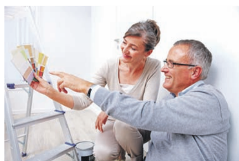
Renovieren kann Spaß machen - über die Finanzierung der Maßnahmen sollte man sich allerdings frühzeitig beraten lassen.

Ein Bausparvertrag etwa ist grundsätzlich nicht nur für Bauherren interessant - er kann auch dafür sorgen, dass einen die Renovierung der Bestandsimmobilie