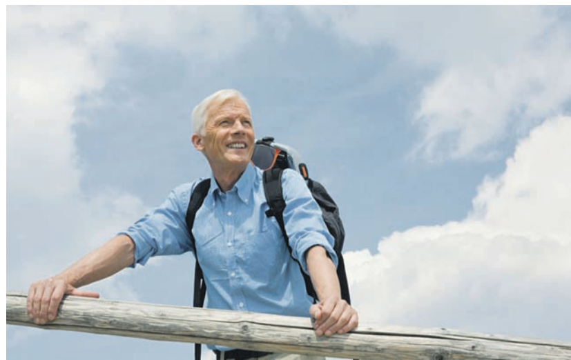
Wer Schmerzen sofort behandelt, fühlt sich schneller wieder fit und kann seinem Hobby nachgehen.

Die Anwendung von Wärme oder Kälte zur Schmerzlinderung ist seit der Antike bekannt und gehört auch heutzutage noch zu den wichtigsten Hausmitteln. So legt man eine Wärmflasche auf einen schmerzenden Bauch oder hält einen verbrannten Finger unter kühlendes Wasser.