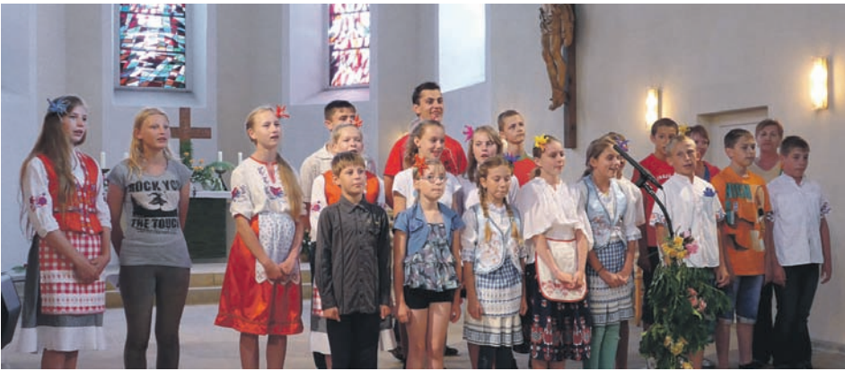
Unsere weißrussischen Kinder bedanken sich auf das Herzlichste bei allen Konzertbesuchern für den Beifall und die Spenden.

Für ein ganz besonderes Musikerlebnis sorgten am Samstagnachmittag die weißrussischen Kinder des Tschernobylkinder e.V.. Sie sind gerade zur Erholung in Radeberg und wollen den Gastgebern natürlich auch etwas zurückgeben. In der Stadtkirche sangen sie für ihre Zuhörer. Am Dienstag dieser Woche ging es für die Kinder in das Dynamostadion nach Dresden, mehr dazu lesen Sie in unserer nächsten Ausgabe.