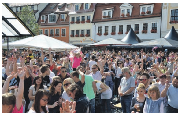
Bei sonnigem Wetter warteten die Besucher gespannt auf den Radeberger Funkenflug.

das Publikum und die Jury. Außerhalb der Wertung tanzte der Großerkmannsdorfer Karnevalsclub. Denn hier legte der Nachwuchs eine flotte Sohle aufs Parkett. Mit der Tanzgruppe des RSV kann der Verein nun aus den vollen schöpfen, schließlich steht mit der 50. Saison ein großes Jubiläum ins Haus.