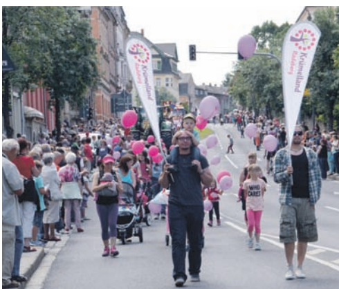
Für den Nachwuchs wird gesorgt, dass bewies das Team vom Krümeland Radeberg.