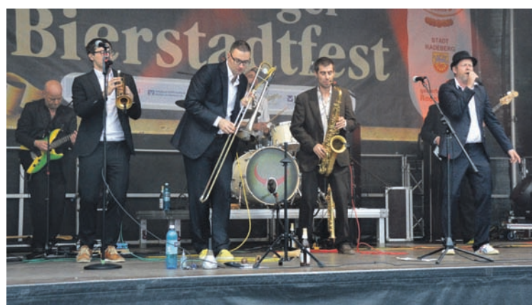
Für einen entspannten Ausklang des 21. Bierstadtfestes sorgten am Sonntag Yellow Umbrella mit ihren Raggae- und Skaklängen.