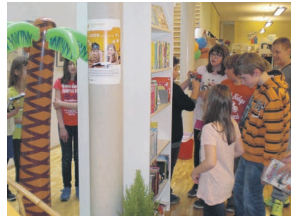
Am 16. Juni wurde der Buchsommer in der Radeberger Stadtbibliothek eröffnet. Das Stöbern ging sofort los!

Montag 11:00 – 18:00 Uhr Dienstag 10:00 – 18:00 Uhr