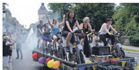
Der Peoples Fitnessclub begeisterte mit seiner Spinning-Bike-Einlage zum Festumzug.