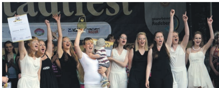
Zum vierten Mal in Folge holten sich die Mädels vom KC Arnsdorf den Sieg beim Funkenflug.