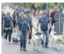
Auch die Mitglieder des Radeberger Hundefreunde e.V. präsentierten sich.