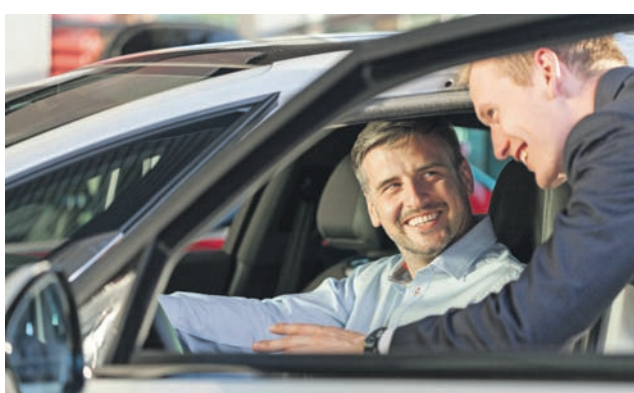
Verbraucher sind gut beraten, beim Autokauf bewusst auf spritsparende Technologien wie etwa eine Benzin-Direkteinspritzung zu achten.

- Ganz klar zur Benzindirekteinspritzung. Vor wenigen Jahren waren Fahrzeuge mit dieser Technik noch eine Seltenheit, heute gibt es Angebote in nahezu allen Fahrzeugsegmenten, vom Kom-