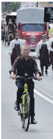
Oberbürgermeister Gerhard Lemm eröffnet, wie in jedem Jahr, den Festumzug. Diesmal ganz sportlich auf dem Fahrrad.