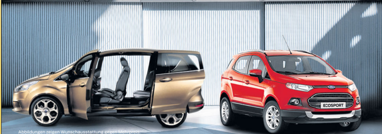
Abbildungen zeigen Wunschausstattung gegen Mehrpreis.