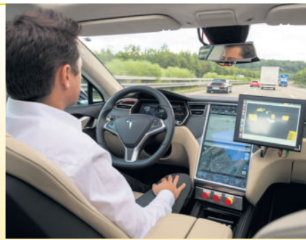
Fahren ohne Stress: Das hochautomatisierte Fahrzeug befindet sich bereits in der Erprobung.

Die Mehrheit der Befragten erwartet eine Entlastung und mehr Sicherheit in vielen alltäglichen Situationen. Auf die Frage "Wann würden Sie das Auto selbst fahren lassen?" antworteten knapp zwei Drittel der Verbraucher mit langen Strecken oder dem Weg in den Urlaub. Die Umfrage ergibt zudem ein interessantes Ranking der gewünschten automatisierten Fahraufgaben: Das Einparken wird dabei besonders oft genannt, ebenso die selbsttätige Parkplatzsuche in Innenstädten sowie das komfortable Weiterkommen im Stau.