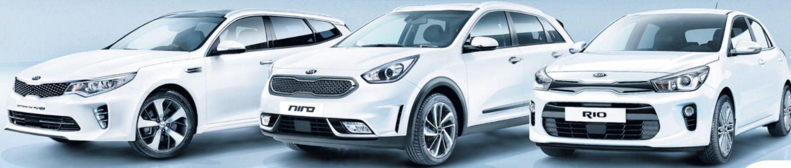
Abbildung zeigt kostenpflichtige Sonderausstattungen.