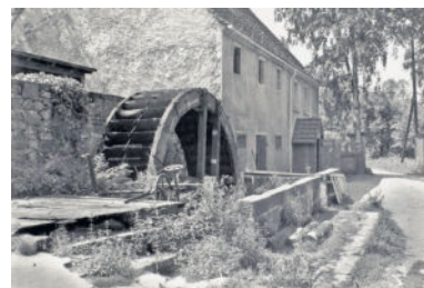
Wasserrad, Auszugshaus 1947; SLUB df hauptkatalog 0500981, P. Schulz

Grundlegende besitzmäßige Veränderungen, an den über Jahrhunderte zur Hüttermühle gehörenden Ländereien, mussten 1938 vorgenommen werden. Nach dem bereits 1933 beschlossenen „Reichserbhofgesetz“, das vom Ansatz her die Höfe vor „Überschuldung und Zersplitterung im Erbgang schützen sollte“, wurde die Hüttermühle 1938 bewertet und nicht als „Erbhof“ eingestuft. Damit war die Mühle nicht vor Zwangsvollstreckungen geschützt, konnte aber (im Gegensatz zu Erbhöfen) weiterhin als Kreditsicherheit eingesetzt und/oder verkauft werden, wobei alle hypothekarischen Belastungen bestehen blieben. Zur Tilgung der Hypotheken musste Wetzlich die wenigen noch zum Besitzum