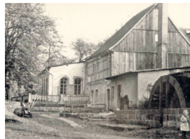
Die „Reste“ um 1950, Museum Klippenstein

Für den Saalbetrieb waren neue Schankkonzessionen erforderlich, die ihm nur schleppend und vorerst nur für jährlich 24 Veranstaltungen bzw. 1927 „für 40 Sonntage Dielentanz“ erteilt wurden. Schon damals