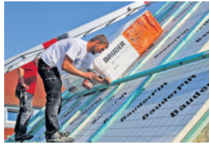
Es lohnt sich, besser zu dämmen als in der Energieeinsparverordnung (EnEV) gefordert. Denn nur dann können zur Finanzierung staatliche Förderungen beantragt werden.

Laut dem Dämmstoffhersteller Paul Bauder können sich die Mehraufwände aber auch unmittelbar rechnen. Denn wer besser dämmt als vom Gesetz vorgeschrieben, hat die Möglichkeit, den Gesetzgeber über Fördergelder der KfW Förderbank an der Finanzierung zu beteiligen. Unter www.ratgeberdach.de gibt es mehr Informationen zur Planung und Finanzierung sowie ein Rechenbeispiel. Förderungen gibt es sowohl für den Neubau als auch für die Althausanierung, wenn vorgegebene Standards eingehalten werden. Gewährt werden kann die Förderung als besonders zinsbegünstigter Kredit, wenn die Maßnahme fremdfinanziert werden soll, oder über direkte Zuschüsse, wenn der Hausbesitzer oder Bauherr mit eigenen Mitteln finanziert. Unterm Strich kann eine bessere Dämmung durch die staatlichen Zuschüsse günstiger ausfallen, wenn man genau rechnet.