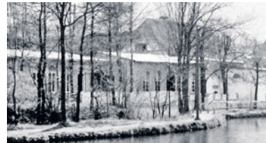
Saalbau und Gesellschaftszimmer; rechts das Wohnhaus und der Wasserrad-Überbau

Eilgassänger-Bundesfest in Radeberg v. 16.-18. Juli 1927 war bei ihm das Standquartier des MGV Eisenwerk Schmiedeburg. Da die von Paulfer um 1900 eingerichtete elektrische Lichtanlage, aufgrund der erfolgten Beauftragungen, nicht für den vollen Saalbetrieb, das Haus und die Zugangswege ausreichte, musste deshalb 1927 der Anschluss an das