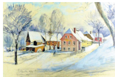
„Die Hüttermühle“, Aquarell des Radeberger Maler-Chronisten Karl Sianka, 1930. Der frühere Wallrodaer Fahrweg kommt von rechts hinten, mit Blick auf den Wohnhaus-Anbau mit dem Sandstein-Bogen.

gentums-Übertragung erfolgte jedoch erst 1927. Der rege und erfolgreiche Geschäftsbetrieb hatte sich über den 1. Weltkrieg hinaus erhalten. Max Saalbach machte sich auch durch seine gute Küche einen guten Namen. Auch Max Saalbach hatte neue Ideen. Er wusste, durch entsprechende Angebote, die Jugend für sich zu gewinnen und musste sich vergrößern. Zwischen dem 1891 von Paulfer errichteten „Gesellschaftszimmer“ im Anbau und dem ehem. Mahlmühlen- bzw. Wohngebäude, das verkürzt