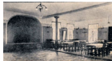
Der 1926 erbaute Hüttermühlensaal

trugen jedoch zur Geschäftsbelebung bei. Saalbach verstand es auch, seine Hüttermühle in landesweite Großereignisse einbeziehen zu lassen. Zum 18. Sächsischen