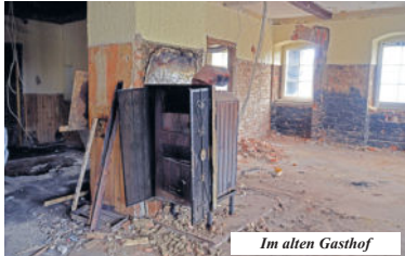
In alten Gasthof

Walmdach erkennen, welches an den alten Gasthofanbau erinnern soll. Diese Dachform verläuft übrigens an allen vier Seiten schräg, sodass auch die Giebelseiten überdacht sind. Man darf also gespannt sein, wie es auf der Baustelle in Ullersdorf weitergeht. Die Grundschüler werden ihren „leißigen Handwerker“ auf jeden Fall auch nach den Sommerferien noch eine ganze Weile zusehen können.