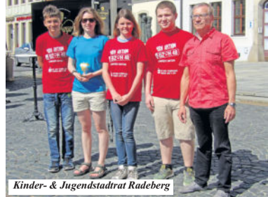
Kinder- & Jugendstadtrat Radeberg

widmet – der Fantasie sind keine Grenzen gesetzt. Und so entstehen Jahr für Jahr vorzeigbare Projekte, so bunt wie die Teams selbst. Im Fokus stehen neben dem gemeinnützigen Zweck aber auch die Stärkung des Gruppenzusammenhaltes, Anerkennung und vor allem Spaß. Anmelden können sich die Teams über die jeweiligen Regionalbüros oder online über die oben genannte Webseite. Kleiner