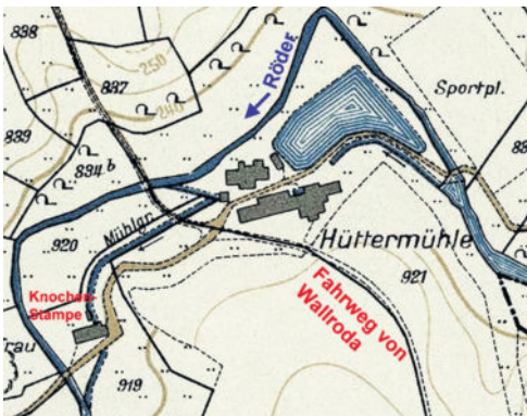
Das Umfeld der Hüttermühle um 1935. Der Mühlgraben nördlich der Hüttermühle ist fast völlig abgedeckt bzw. zugeschüttet.