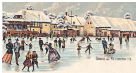
GRUSS AN RADEBERG 1918