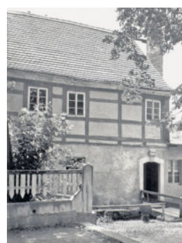
Wohnhaus 1947

1923 baute der „Sportclub 1907“ die bereits genannte große Wiese rechts der Röder zu einem „vorschriftsmäßigen Platz zur Ausübung des Fußballsports“ aus. Drainagen