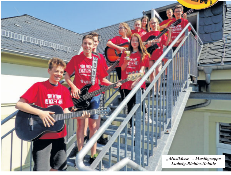
„Musiküsse“ - Musikgruppe Ludwig-Richter-Schule

Vielen ist das Projekt mittlerweile ein Begriff und gerade im ländlichen Raum helfen die kleinen Taten manchmal große Wirkung zu erzielen. Es kann beispielsweise etwas im Ort renoviert oder gebaut werden, Sportprojekte können genauso wie Kulturprogramme oder Feste veranstaltet werden oder es wird sich der Natur bzw. der Umwelt ge-