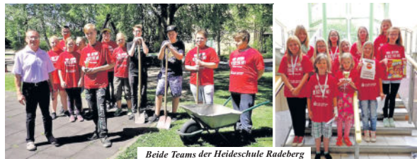
Beide Teams der Heideschule Radeberg