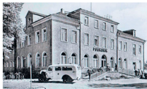
Historisches Foto vom Radeberger Schießhaus um 1900

Für viele Leser möglicherweise überraschend, erfährt die Radeberger Hutfabrikation, die in den ersten Jahrzehnten des 20. Jh. Hunderten Arbeit und Brot gab, eine späte aber verdiente Würdigung. Wie in den zurückliegenden Jahren bereits praktiziert ist, ist auch in diesem Jahr dem Brauwesen, dem Bierhandel und der Gastronomie der ihm gebührende Platz