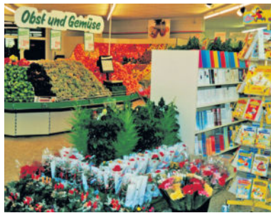
Schöne bunte Welt – 1994 eröffnete der damalige Spar-Markt an der Stolpener Straße (heute Kleinwachauer Werkstätten)

Artikel anstehen“, sondern aus „einer riesigen Auswahl das richtige mit nach Hause nehmen“. Gab es sonst von allem nur eine oder wenige Marken, erstreckte sich in den endlosen Regalen der neueröffneten Supermärkte die volle Breite inrederdeutscher und auch importierter Ware. Dazu kommen die lockenden Angebote bestehend aus „Non-Food-Artikel“ also „Keine Lebensmittel“, wie beispielsweise Kleidung, Werkzeuge, Dekoration, Gartengeräte und elektronische Ware. Plötzlich steht man also doch wieder der Schlange an den Angebotstagen, nur dass es diese Produkte nun im Überfluss gibt. Bekommt man es nicht, kauft man einfach woanders.