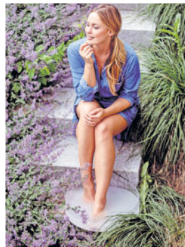
Einfach abtauchen: Ein Fußbad mit Lavendel hat einen beruhigenden, entspannenden Effekt.