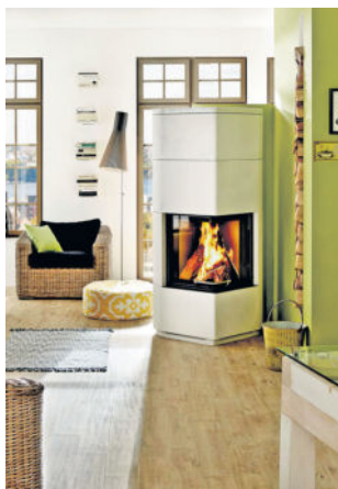
Zeitgemäße Kachelöfen, Heizkamine und Kaminöfen leisten einen unverzichtbaren Beitrag zur CO 2 -Reduktion, zur Einsparung fossiler Energieträger und damit zur Wärmewende und zum Klimaschutz.

Mehr Informationen gibt es unter www.kachelofenwelt.de .