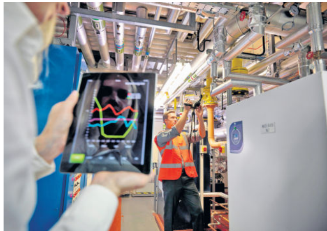
Unternehmen investieren verstärkt in den Klimaschutz - und auch Verbraucher können von Energiesparpotenzialen profitieren.