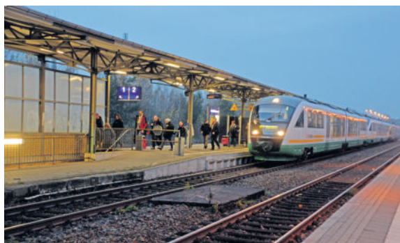
Täglich nutzen viele Menschen den Bahnhof in Arnsdorf.