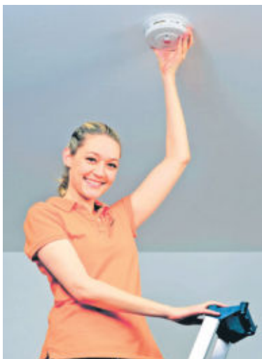
Installieren Sie Rauchmelder gemäß Bedienungsanleitung des Herstellers. Ein Rauchmelder, hilft Rauch frühzeitig zu erkennen und Leben zu retten.

Bevor man einen Rauchmelder kauft und anbringt gibt es allerdings auch einiges zu beachten. Zunächst sollte man sich informieren, wie viele Rauchmelder nötig sind. Wie sind die Räume angeordnet? Beim Kauf kann die aktuelle Erhebung der Stiftung Warentest 01/2018 helfen. Getestet wurden die Geräte auf Zuverlässigkeit, Lautstärke des Alarms, Handhabung, Robustheit und Deklaration. Ein zusätzliches Gütesiegel ist ein „Q“ auf der Verpackung. Es steht für eine lange Lebensdauer der Batterie und des Rauchmelders, erhöhte Stabilität und die Reduktion von Fehlalarm. Ein Fehlalarm kann beispielsweise durch Rauch, Insekten oder Staub verursacht werden, die den Sensor unterbrechen.