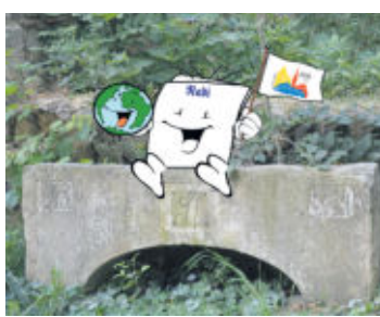
Unser Rubi hat ihn im Schloss Klippenstein entdeckt – den steinernen Türbogen, welcher sich vermutlich an einem Gebäude auf der Dr.-Wilhelm-Külz-Straße befunden haben könnte. Die genaue Herkunft wird im Moment bestimmt.

„Unter Klein- und Flurdenkmälern sind Grenzsteine, Gemeindesteine, steinerne Türbögen mit Initialen, historisch steinerne Wegweiser, Sühnekreuze, Grabmale außerhalb von Friedhöfen, Denksteine an historische Ereignisse usw. zu verstehen. Sie haben lokale Bedeutung und weisen zum Teil auf unsere einstige Verwaltungsstruktur und das alte Rechtswesen hin. Sie stehen nach SächsDSchG unter Schutz! Inzwischen entstehen an alten Burgen, Schlössern und Museen „Lapidarien“ - eine Sammlung für derartige Steine, welche vor Ort nicht wieder aufgestellt werden können. Sicherlich kennen einige Radeberger solche Steine, welche im Schlosshof ihren Platz hatten. Hier finden derzeit umfangreiche Baumaßnahmen statt. Diese Maßnahmen sind den Besuchern mit dem sanierten Schlosssteich, dem neu gestalteten Schlosshof und dem Schlossgarten augenscheinlich. Der Klippenstein e.V. steht hinter diesen Maßnahmen und begrüßt insbesondere den Aufzug, der künftig auch Behinderten einen Museumsbesuch erleichtert.“