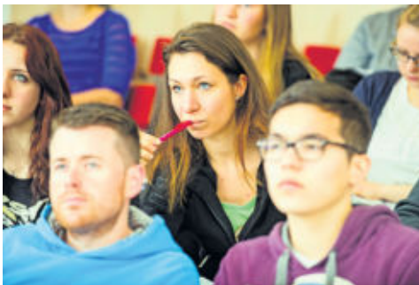
Lebenslanges Lernen und berufliche Weiterbildung sind mittlerweile unverzichtbar geworden.

(djd). Das Wissen aus einer Erstausbildung oder einem Erststudium veraltet immer schneller, lebenslanges Lernen und berufliche Weiterbildung sind mittlerweile unverzichtbar geworden. Mit aktuellem Know-how und Zusatzqualifikationen ist man nicht nur viel besser vor einem Jobverlust gefeit - man verschafft sich dadurch auch ganz andere Karriere- und Gehaltsmöglichkeiten. Gewünscht sind dabei vor allem Qualifizierungen mit einem hohen Praxisbezug. In diesem Zusammenhang steigt insbesondere die Nachfrage nach Fernstudienangeboten. Der Vorteil ist, dass man beim berufsbegleitenden Studieren weder den Arbeitsplatz noch das geregelte Einkommen aufgeben muss. Der besondere Clou: Man muss nicht gleich ein komplettes Masterstudium in Angriff nehmen, sondern kann sich beispielsweise mit bestimmten Modulen einer Hochschule gezielt und sehr flexibel weiterbilden.