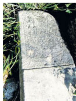
Diese Wegesäule von 1793 stand einst am Radeberger Obertor.

Wie haben sich diese Veränderungen auf Radeberg ausgewirkt? „Straßenführungen haben nicht nur Veränderung erfahren sondern wurden nach heutigen Bedürfnissen wesentlich erweitert. Auch innerhalb unserer Stadt Radeberg mussten die einstigen Stadttore zu Beginn der Industrialisierung dem gestiegenen Verkehr weichen. Schon damals fand man die Türschlosser der Stadttore für bewahrenswert. Sie landeten in der Altertumschänke und wurden 1953 Bestandteil des Inventars vom Museum Schloss Klippenstein.“