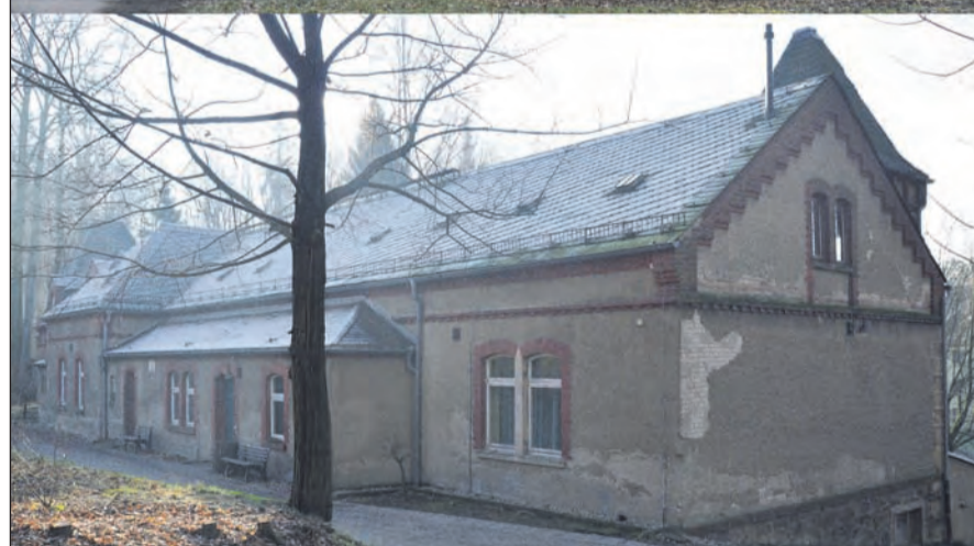
Die schöne Außenfassade soll erhalten bleiben - doch was sich ab Herbst im Gartenhaus tut, steht noch nicht fest.