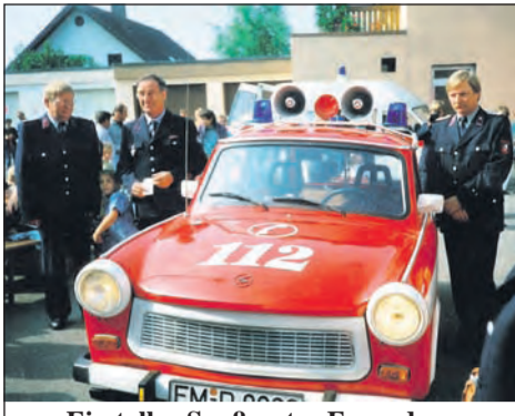
Ein toller Spaß unter Freunden: 1994 - Die Feuerwehr Denzlingen bekommt von den Arnsdorfer Kollegen einen Trabi als Dank für das gespendete Einsatzfahrzeug im Vorjahr.