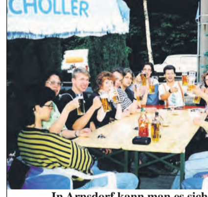
In Arnsdorf kann man es sich richtig gut gehen lassen - Denzlinger und Arnsdorfer Zivis beim Treffen 1992.

Mittlerweile sind die offiziellen Besuche weniger geworden. Doch man steht in Kontakt und hat natürlich nicht vergessen, dass die „Ehe ohne Vertrag“ zwischen Denzlingen und Arnsdorf in diesem Jahr „Silberhochzeit“ feiert. 25 Jahre verbindet die recht unterschiedlichen Orte ein Band der Freundschaft, welches auf recht ungewöhnliche Weise entstand. In Denzlingen will man sogar ein Heft zum Jubiläum herausbringen, dass geht natürlich