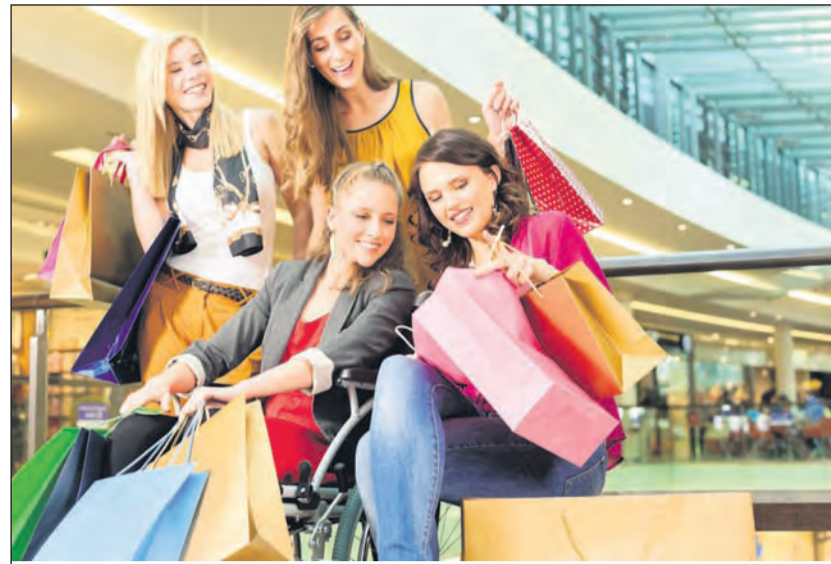
Shopping macht besonderen Spaß, wenn man beim Einkaufsbummel auf Schnäppchen stößt. Die meisten Bundesbürger schauen sich einer Umfrage zufolge ganz bewusst nach Sondernageboten um.

Spiel. Wer es lieber klassisch mag, kann die stylischen Blumenprints auch in der Farbkombination schwarz / weiß tragen. Wieder zurück - der Army- und Safari Look. Bei diesem Trend lässt sich sicherlich noch etwas Verborgenes im Kleiderschrank finden. Schlichte Outfits werden in diesem Jahr mit auffälligen Accessoires aufgepeppt. Großer, protziger Schmuck löst die filigranen Stücke vom Vorjahr ab. Ohrhänge setzen in diesem Jahr Statements, mit Perlen und Steinen verziert und aus Holz oder Metall, folgt der Ohrschmuck dem Schmuck-