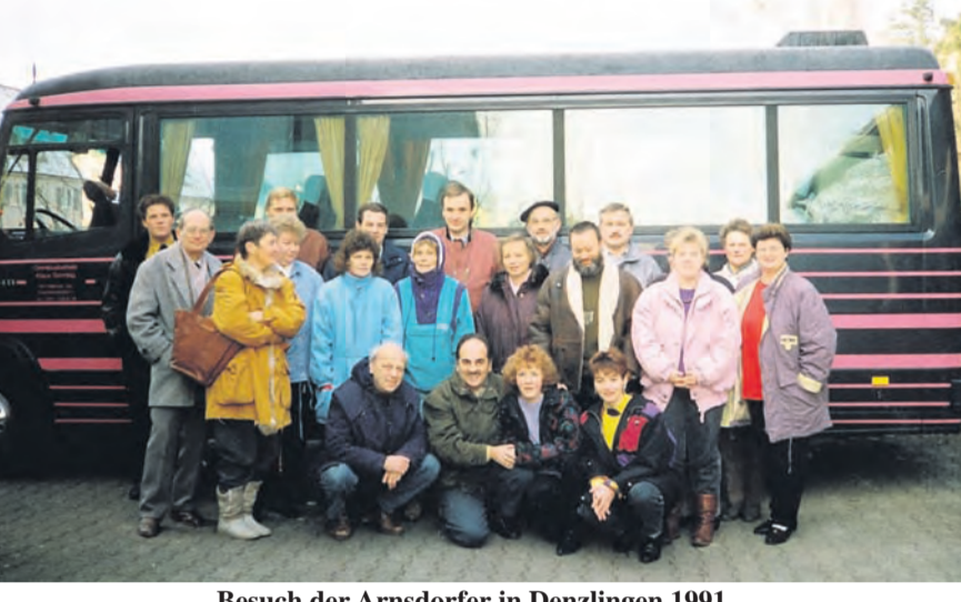
Besuch der Arnsdorfer in Denzlingen 1991.