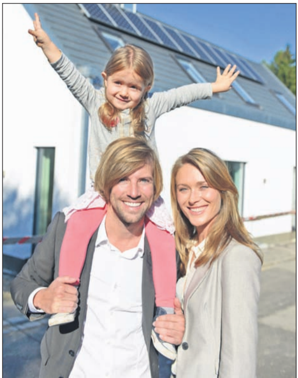
Dank einer vorausschauenden Vermögensberatung können junge Familien oftmals eher eine eigene Immobilie finanzieren.

Für unsere Kunden suchen wir Immobilien, wie Whg., EFH, DHH, RHH, ZFH, MFH, Grdst. u. Villen zum Verk. oder Vermietg. in DD, Radeberg und Umgeb., f. Verkäufer provisionsfrei, Tel.: 03528/445766 o. www.popp-immobilien-radeberg.de