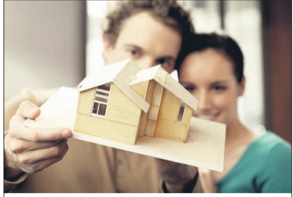
Immobilienkäufer sollten einen Anteil in Höhe von 20 bis 30 Prozent aus eigenen Mitteln finanzieren können.

(djd/pt). Fleißige Sparer sind angesichts der niedrigen Erträge frustriert, doch angehende Eigenheimbesitzer jubeln über den extrem niedrigen Leitzins der Europäischen Zentralbank (EZB). Unter anderem sorgt dies auch für mehr Baugenehmigungen: Im ersten Halbjahr 2014 wurden laut Statistischem Bundesamt 136.800 Wohnun-