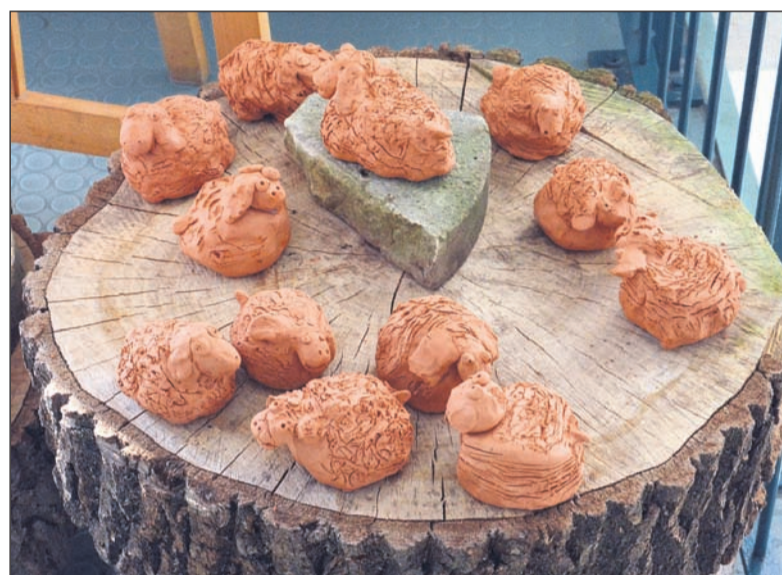
Eine besondere Anerkennung erhielten die Schüler der Klasse 1a von der GS Mitte für ihre Projektarbeit "Eine ruhende Schafherde" aus Keramik.