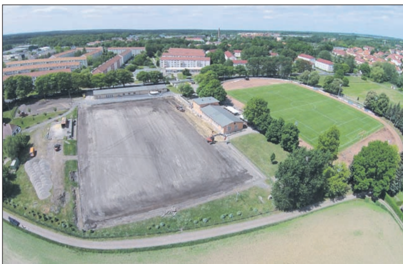
Aus der Vogelperspektive hat man einen guten Vergleich vom alten grauen Hartballplatz zum jetzigen leuchtend grünen Kunstrasenplatz.

Viele Aktivitäten zur Anschaffung eines Kunstrasenplatzes für den ehemaligen Hartballplatz im Radeberger Stadion Schillerstrasse sind nun schon fast wieder Geschichte. Da liefen umfangreiche Spendenaktionen, das große Benefizspiel gegen Dynamo Dresden mit Besucherrekord und auch umfangreiche Eigenleistungen der RSV-Mitglieder am neuen Kunstrasenplatz. Die Arbeiten der Fachfirmen sind nun abgeschlossen. Die Bauabnahme (Foto unten) des Kunstrasenplatzes als auch der Nebenflächen erfolgte am Montagvormittag dieser Woche gemeinsam mit dem zuständigen Planungsbüro Holm Grünberg, Mario Malech Firma Faber als Hauptauftragnehmer und Torsten Schindler der Firma Polytan als Kunstrasenspezialist unter den kritischen Augen der zukünftigen Betreiber des RSV mit dem Vorsitzenden Dr. Wolfgang Lambrecht, Geschäftsführer Klaus Vieczek,