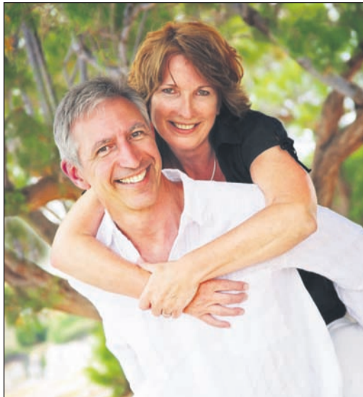
Wer im Alter fit und gesund bleiben will, sollte beizeiten auf eine gesunde Lebensführung achten.

(djd/pt). So fit und geistig rege waren sie noch nie: Wie eine Studie mehrerer Berliner Forschungsinstitute zeigt, sind die heute 75-Jährigen deutlich zufriedener als die vergleichbare Altersgruppe noch vor 20 Jahren. Neben körperlicher Fitness und intakten kognitiven Fähigkeiten spielt die Selbstständigkeit eine wichtige Rolle für die Lebensqualität der Generation. Eine gesunde Lebensführung kann maßgeblich zum Wohlbefinden der Senioren beitragen. Dabei sollte man nicht zuletzt auch auf seinen Blutdruck achten. Wer bei Abweichungen frühzeitig gegensteuert, kann für gesunde Werte sorgen, ohne auf Blutdrucksenker angewiesen zu sein.