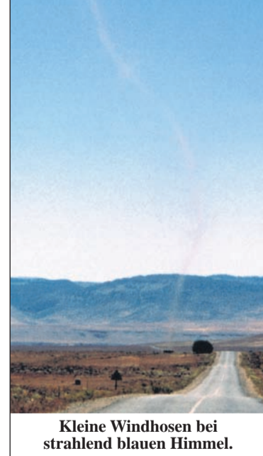
Kleine Windhosen bei strahlend blauem Himmel.

Bei Gewitter und Sturm bleibt man besser in geschützten Räumen mit fest geschlossenen Fenstern und Türen. Auch elektrische Geräte sollten nicht nur ausgeschaltet sein, sondern es ist besser den Stecker zu ziehen. Sollte man sich allerdings im Freien befinden, ist der Volksspruch „Vor Eichen sollst du weichen, Buchen sollst du suchen“ nicht gerade hilfreich, denn der Gewitterblitz ist kein Botaniker und schlägt in den Baum ein, welcher aus physikalischen Gründen der Günstigste ist. Besser ist, man sucht sich eine Senke und macht sich so klein wie nur möglich. Dagegen ist man im Auto auf Grund des Faradayschen Käfigs der Karosserie relativ sicher vor einem Blitz. Bei einem erkennbaren Tornadorisiko sind die lokalen Windgeschwindigkeiten / Zerstörungskräfte wesentlich höher als bei einem üblichen Gewitter. Im unmittelbaren Wirkungsbereich ist man im Hauskeller am besten geschützt. Im Freien verwandelt der Tornado abgerissene herumfliegende Teile aller Art zu regelrechten Geschossen mit enormer Zerstörungswucht.