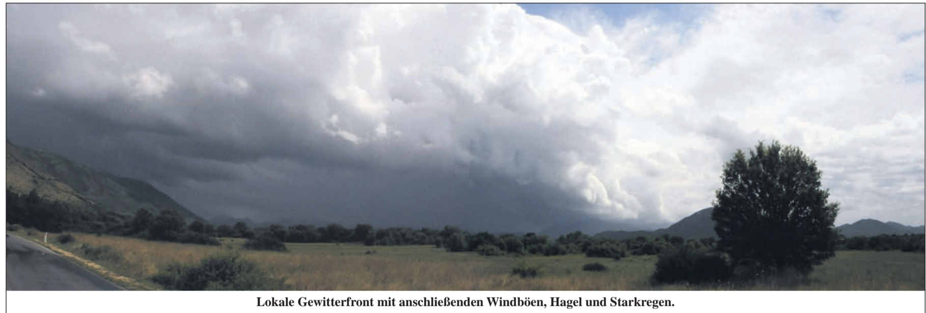
Lokale Gewitterfront mit anschließenden Windböen, Hagel und Starkregen.

In den vergangenen Jahren haben gefühlsmäßig auch in unseren Landstrichen die Unwetter an Häufigkeit und Extremität zugenommen. Dabei reichen die wissenschaftlichen Betrachtungen und Spekulationen von durch die Menschheit hausgemachtem Klimawandel bis hin zu den erdgeschichtlichen Klimazyklen. Diese Klimadiskussion soll allerdings nicht Gegenstand dieses Artikels sein, sondern vielmehr die Sensibilisierung auf die veränderten „extremere“ Wetterereignisse und wie sich jeder Einzelne informieren, verhalten und auch schützen kann.