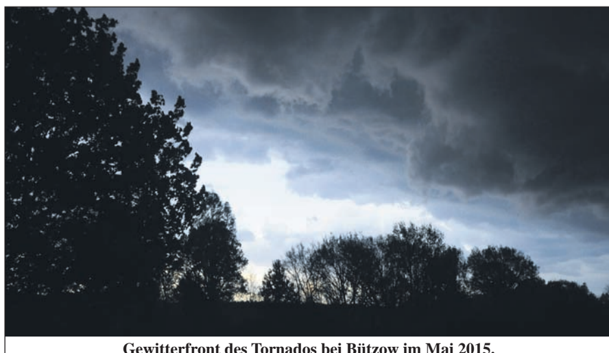
Gewitterfront des Tornados bei Bützow im Mai 2015.