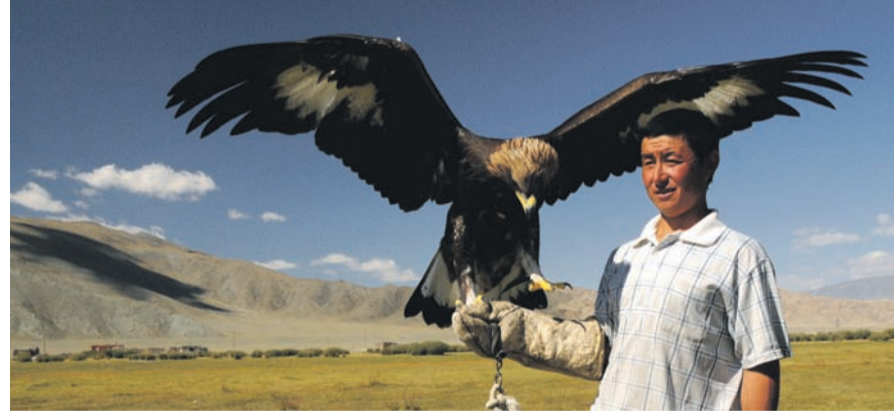
Das Altai-Gebirge um die Stadt Ölgi ist bekannt für seine Tradition der Adlerjäger, welche wir in einem Tal bei Tsengel getroffen haben.