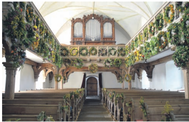
Über 70 Erntedankkränze und weitere Gaben schmücken den Innenraum der Seifersdorfer Kirche.

Neben der Besichtigung der einzelnen Schlossanlagen, gab es noch zusätzliche Angebote zum Tag des offenen Denkmals und der damit verbundenen Schlössertour. So war die Kirche in Seifersdorf für alle geöffnet und wer einen Blick ins Innere warf, war sofort in den Bann der über 70 Kränze zum Erntedankfest und der festlichen Dekoration des Altares gezogen. Nahm man sich einen Moment Zeit und hielt auf einer der ebenfalls geschmückten Kirchenbänke inne, konnte man die herbstliche Dekoration auf sich wirken lassen und somit die Arbeit ehren.