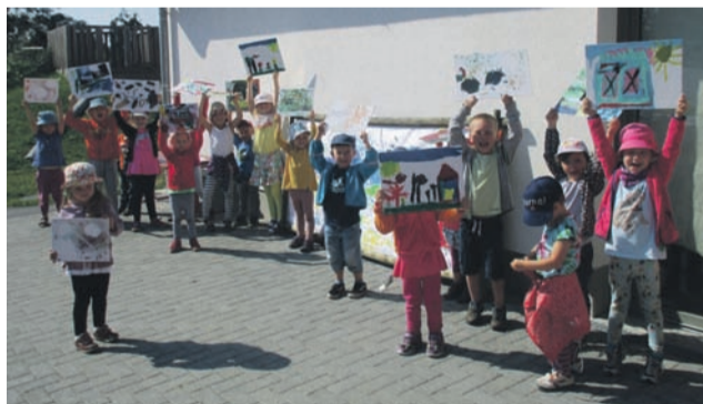
Die Kinder der neuen Seifersdorfer Kita gestalteten für den Tag des Denkmals schon im Vorfeld tolle Bilder für ihre Ausstellung.

Zum Tag des offenen Denkmals, wurden Kunstwerke der Kinder des Kindergartens Himmelsleiter im Seifersdorfer Schloss ausgestellt. Gemeinsam mit den Erziehern, haben sich die Kinder ihren Heimatort genauer angeschaut und sich ihre Lieblingsplätze heraus gesucht, um sie künstlerisch darzustellen. So kamen zum Beispiel die Exponate: „Sturm an der Hermannseiche“, „Mein