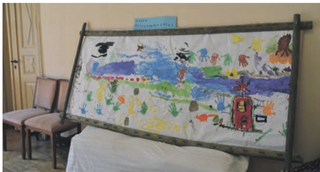
In den ehemaligen Räumen der Kita im Schloss Seifersdorf staunten Besucher über die Werke der kleinen Künstler.

Zuhause“ oder „Die Eselsbrücke“, zustande. Die Kinder erkundeten mit großer Freude ihren Heimatort und haben dabei die Vielfältigkeit von Seifersdorf und seiner Umgebung noch intensiver und aus anderen Blickwinkeln wahrgenommen. Alle freuen sich schon sehr, noch weiter auf Entdeckungstour zu gehen und Seifersdorf wieder „unsicher“ zu machen.