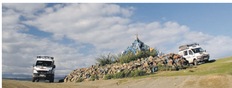
Auf den Bergpässen versuchen auch wir an einem Owo die Bergeister günstig für uns zu stimmen.

Ein ausführlicher Reisebericht folgt in den nächsten Wochen, wenn wir wieder zurück in der Heimat sind.