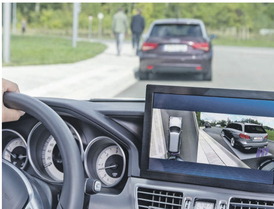
Bequemer einparken: Parkassistenzsysteme zählen zu den beliebtesten elektronischen Helfern im Auto.

Kommt vorbei, es gibt viel Action und für das leibliche Wohl ist gesorgt!