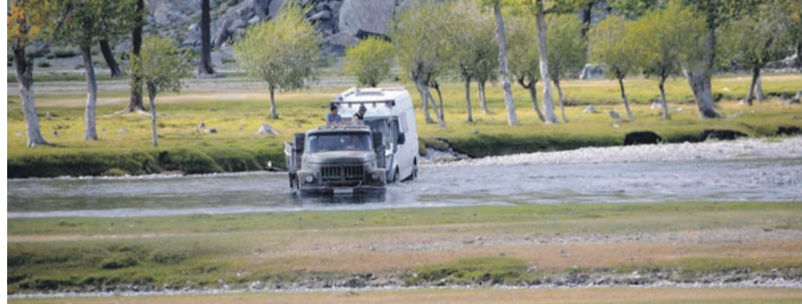
Die starke, reißende Strömung im Fluss ließ uns keine andere Wahl. Nur am Stahlseil hinter einem schweren Lkw konnten wir den Strom durchqueren.