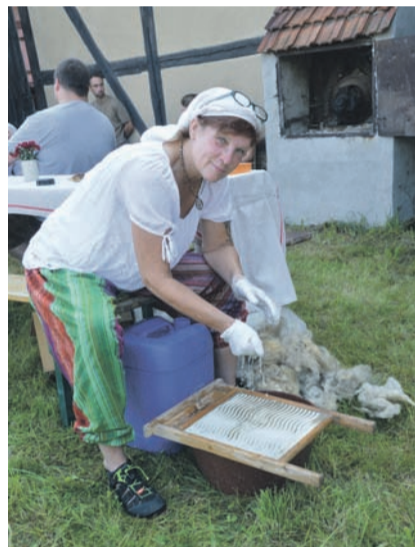
Auch in der Museumsscheune Wachau war wieder allerhand los - hier wird gefilzt.

In der Museums-scheune in Wachau waren historische Gewerke, landwirtschaftliche Geräte und vieles mehr zu erleben. Im Durchgang der großen Scheune konnten die Besucher alte Filmaufnahmen der Wachauer ansehen. Der ein oder andere erkannte vielleicht sogar noch den Bäcker oder eine liebe Nachbarin. Es konnte gebastelt werden, Tiere konnten gestreichelt werden, es wurde gefilzt, mit Lehm gearbeitet und ein kleiner Flohmarkt lud ebenfalls zum Stöbern ein. Der Insider Tipp Museumsscheune mausert sich langsam zum Publikummagneten. Auch in diesem Jahr wird es hier wieder einen kleinen Weihnachtsmarkt geben, näheres erfahren Sie natürlich in unserer Heimatzeitung.