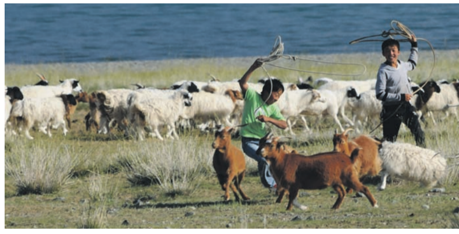
Die mongolischen Cowboys beim Fangen der Ziegen und Schafe mit dem Lasso.