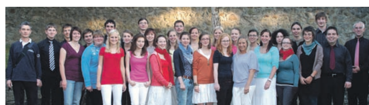
Gruppenbild der Jugendkantorei aus dem Jahr 2012

Jugendkantorei: Um den Wünschen der älteren Kurrendesängern und der Kantorei nachzukommen und das Singen von Spirituals sowie jazziger