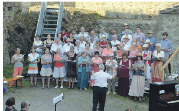
Das jährliche Frühlingskonzert findet immer im Schloss Klippenstein statt.

Kantorei: Etwa 65 Mitglieder zählt die Kantorei Radeberg, welche neben der regelmäßigen Ausgestaltung von Gottesdiensten auch Aufführungen von oratorischen Werken und Konzerte gestalten. Ausflüge, Feiern und Geburtstagsständchen runden den Choralltag ab. Der gemischte Chor singt Werke aus vielen Epochen und Gattungen vokaler Musik. Gepröbt wird immer donnerstags 19.15 bis 21.00 Uhr im Gemeindehaus.