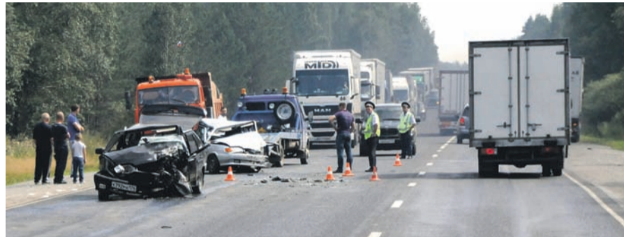
Mit Recht heißt die Strecke zwischen Ufa und Tscheljabinsk „die Straße des Todes“.

Zum dritten Mal reisen wir in die Mongolei. Warum schon wieder? Weil die Mongolei für Offroad-Fahrer noch immer ein freies Eldorado ist. Deshalb war unser diesjähriges Ziel die Gebirgsregionen des Altai im Nordwesten der Mongolei zu erkunden. Mittlerweile sind wir bereits auf der Rückreise. Die Route führte uns über Russland, Richtung Norden - Sibirische Taiga, über den Ural nach Deutschland zurück. Am 06.08.2016 starteten wir mit unseren Fahrzeugen Leo und Ursinus über Polen in Richtung Russland. Die Grenzen passierten wir problemlos und auch der Übergang nach Russland ging recht zügig. Ein Erlebnis ist natürlich immer wieder die Fahrt durch Moskau. Knapp eine Woche nach unserem Start, hatten wir die Mongolei fast erreicht. Asien und der Ural lagen vor uns. Zwei Tage später waren wir bereits im Nordwesten der Mongolei unterwegs und ließen uns wieder von der Magie des Landes einfangen. Nach einem Ruhetag und dem Aufrüsten unserer Autos, begannen wir unsere Reise ostwärts in Richtung Ulaangom. Anfang September konnten wir auf zwei Wochen Erkundungstour zurückblicken. Es ging über Pässe und Täler, Flüsse und durch Tierherden - wieder konnten wir uns von der Hilfsbereitschaft der mongolischen Menschen überzeugen und viele Eindrücke mitnehmen. Einen ersten Einblick gewähren wir nun hier.