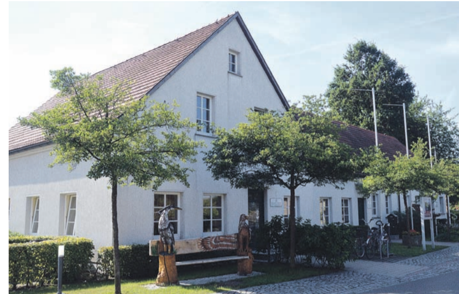
Aktuell befindet sich die Verwaltungsstelle noch im Gebäude Teichstraße 4.

Noch ist es recht ruhig in der Gemeinde Wachau, doch demnächst werden einige Bauprojekte an den Start gehen. Mit dem Programm „Kleinere Städte und Gemeinden“ unterstützt die Sächsische Aufbaubank Gemeinden im Freistaat mit weniger als 15.000 Einwohnern dabei, ihre städtebauliche Infrastruktur der Daseinsvorsorge gemeinsam mit anderen Kommunen bedarfsgerecht anzupassen. Die Förderung zielt auf die Zusammenarbeit der Gemeinden, um beim Infrastrukturangebot langfristig zu kooperieren und dadurch die Lebensqualität in der Region zu stärken. Somit konnten nun lang gehegte Pläne des Gemeinderates