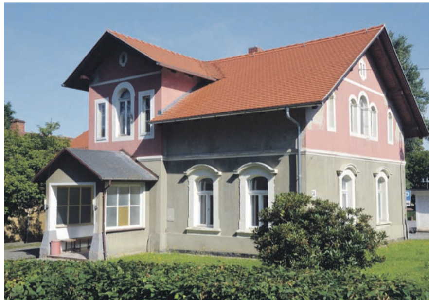
Noch ist es ruhig im alten Gemeindeamt - bald beginnt der Umbau zur Heimatstube.

Ein weiteres lang angestrebtes Projekt ist die Vergrößerung des jetzigen Gemeindeamtes. Bei den momentan sehr beschränkten Platzverhältnissen, sind die Arbeitsbedingungen für das Personal weniger optimal. Gerade im Bereich des Bauamtes sind die Räumlichkeiten unter dem Dach doch sehr klein. Insgesamt arbeiten 15 Mitarbeiterinnen und Mitarbeiter in verschiedenen Abteilungen und Bürgermeister Veit Künzelmann im Haus. Nach Abwägung aller Möglichkeiten entschied sich der Gemeinderat nun