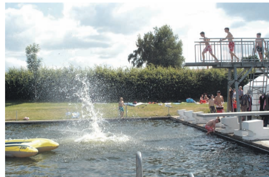
Badespaß im Freibad, auch hier soll in den nächsten Jahren saniert werden.

in die Tat umgesetzt werden. Allerdings betrifft die Förderung nur die öffentlichen Gebäude, sprich, Objekte die der Gemeinde gehören. Zusätzliche Kosten für die Bürger entstehen dabei nicht. Los geht es in wenigen Wochen mit dem alten Gemeindeamt an der Hauptstraße. Das Gebäude wird komplett saniert und dann dem Heimatverein als Wirkungsstätte übergeben. Die Kosten belaufen sich auf rund 140.000 Euro.