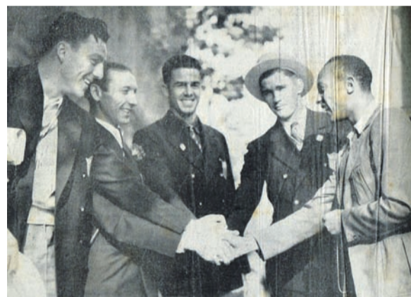
Legendärer Handschlag zur Verabschiedung.

Die angespannte politische Lage in Deutschland, bzw. im damaligen Deutschen Reich, sorgte ebenfalls für einige Schlagzeilen. So rief die USA im Vorfeld auf Grund der Rassendiskriminierung zum Boykott auf. Ein legendäres Zeichen bzw. Bild gegen Rassismus und Diskriminierung war zum Ende der Spiele der Handschlag zwischen dem Afroamerikaner Jesse Owen und seinen „weißen“ Mannschaftskollegen. Auch während der Wettkämpfe gingen die Athleten der verschiedenen Nationen ohne Vorurteile und Diskriminierungen miteinander um.