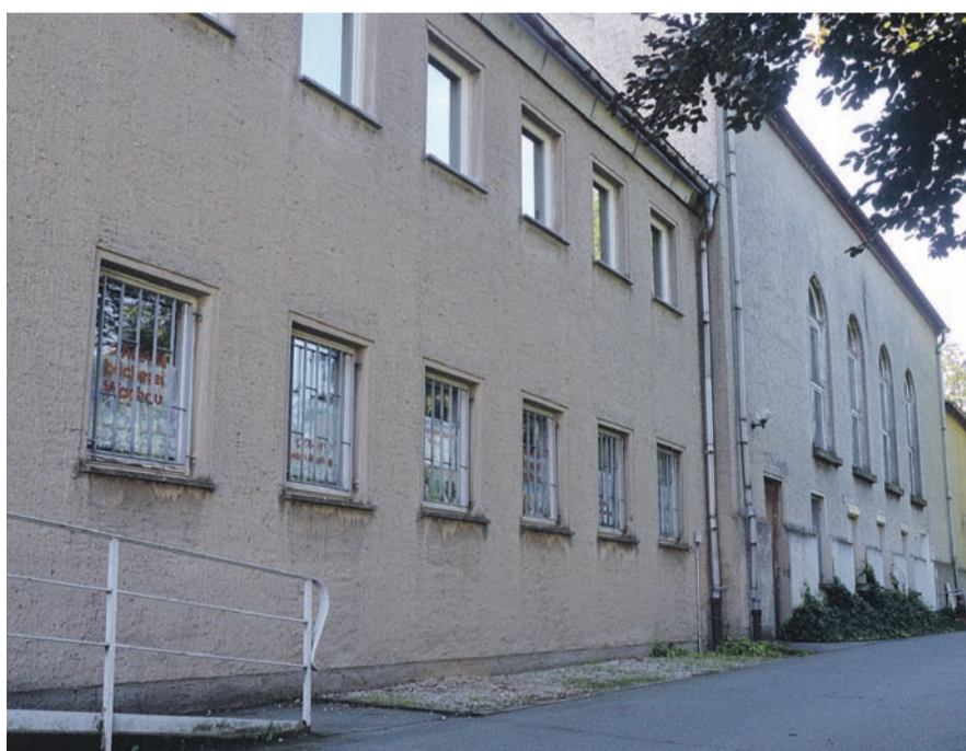
Die alte Turnhalle beherbergt momentan die Gemeindebücherei und eine Zahnarztpraxis. Geplant sind eine komplette Sanierung und der Umbau zur neuen Gemeindeverwaltung.