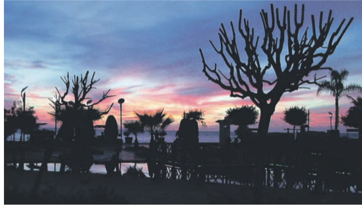
Urlaub in der Türkei machte Familie Gerber aus Radeberg. Sie fotografierten diesen tollen Sonnenuntergang in Alanya.