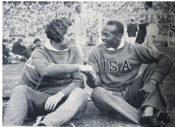
Harmonie unter den Teilnehmern, trotz des Nationalsozialismus in Deutschland.

In der Olympia Zeitung von 1936, herausgegeben vom Reichsportverlag und uns durch Günter Umlauf aus Arnsdorf zur Verfügung gestellt, kann man alles über diese tolle Zeit nachlesen. 49 Nationen mit 3.961 Athleten traten zum Wett-