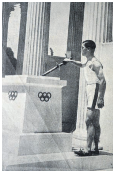
Das olympische Feuer wird entzündet.

Bis weit in die Antike reicht die Geschichte der Olympischen Spiele. Es ist die Historie eines länderübergreifenden Sportwettkampfes, die viele einzelne interessante Geschichten, Anekdoten, Rekorde, Zahlen und Informationen beinhaltet. Jüngst überschattet der Dopingkandal der russischen Sportler die Olympiade in Brasilien, welcher zur Disqualifikation des kompletten Teams führte. Vom 05. bis 21. August werden sich in Rio de Janeiro wieder Athleten verschiedenster Sportarten messen. Das Ereignis findet alle vier Jahre statt und ist der wichtigste Wettkampf sowie das „I-Tüpfelchen“ einer jeden sportlichen Karriere.