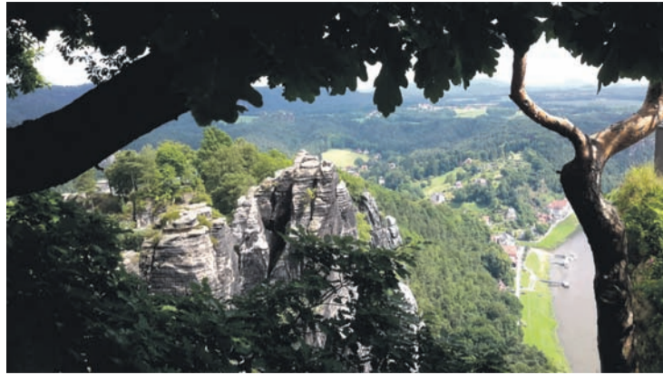
Das Foto entstand auf dem Weg in die Bastei und kommt von Lukas Winkel, 16 Jahre alt, aus Liegau-Augustusbad.

Auch in dieser Woche erreichten uns Urlaubsfotos aus den verschiedensten Regionen und Ländern. Noch bis Mitte September können Sie ihre Schnappschüsse an uns senden. Mittels einer Abstimmung, bei der noch mal alle Bilder zu sehen sein werden, ermitteln wir, in unserer Heimatzeitung und auf unserer Facebook-Seite, Ende September den Sieger. Auch unsere Leser, die fleißig voten, können einen Preis gewinnen. Alle, die ihre Stimme abgeben, kommen automatisch in den Lostopf. Der Sieger unserer großen Urlaubsfoto-Aktion erhält sein eingesandtes Urlaubsfoto auf Leinwand in der Größe 30x40 cm. Der Gewinner unserer Voting-Teilnehmer kann sich ebenfalls über eine Leinwand (30x40 cm) mit einem Foto seiner Wahl freuen. Mitmachen lohnt sich also doppelt! Schicken Sie Ihr Foto unter Angabe Ihres Namens, Wohnortes und des Ferienzieles an: redaktion@die-radeberger.de (Beachten Sie bitte: Das Foto sollte eine Auflösung von mindestens 250 dpi aufweisen, um druckfähig zu sein). Oder kommen Sie einfach mit Ihrem Datenträger bei uns in der Redaktion auf der Oberstraße 16a in Radeberg vorbei. Wir freuen uns auf Ihre Beiträge. Sollten Sie noch Fragen zu unserer Aktion haben, rufen Sie uns gern an unter: Tel. 03528 / 44 23 01.