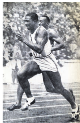
Jesse Owen läuft zum Rekord.