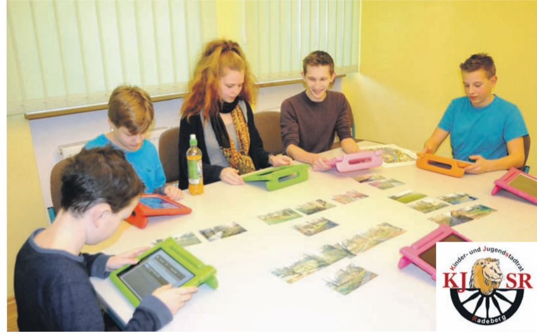
Auf den Tablets konnten die Kinder und Jugendlichen ihre Ideen virtuell umsetzen.

Fußgängerbrücke gebaut werden, ein abgeflachtes Ufer oder Sitzstufen würden den Zugang zum Flüsschen erleichtern. Einige Bäume müssten weichen, um mehr Platz zu schaffen. Schön finden die Mitglieder des KJSR auch die Installation eines Wasserspiels. Fest steht nun auch der Abriss der beiden alten Wohnhäuser an der August-Bebel-Straße.