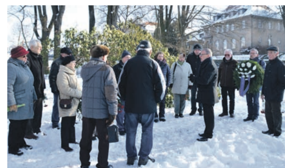
Text & Fotos: Red.