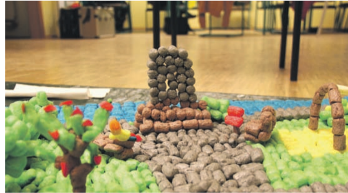
Modell aus PlayMats.