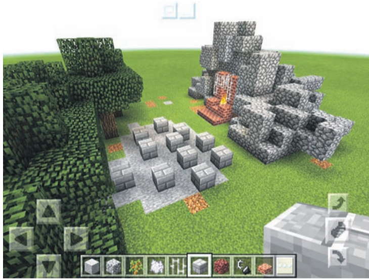
Steinbruch mit Grillplatz und Sitzmöglichkeiten an den Leithen.