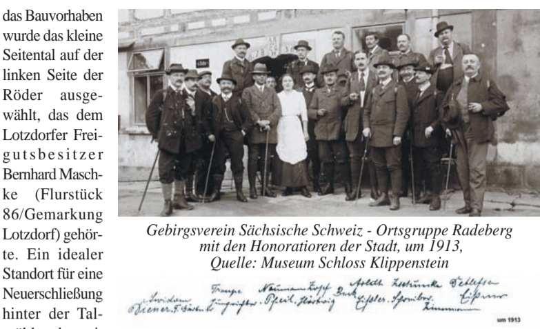
Gebirgsverein Sächsische Schweiz - Ortsgruppe Radeberg mit den Honoratioren der Stadt, um 1913