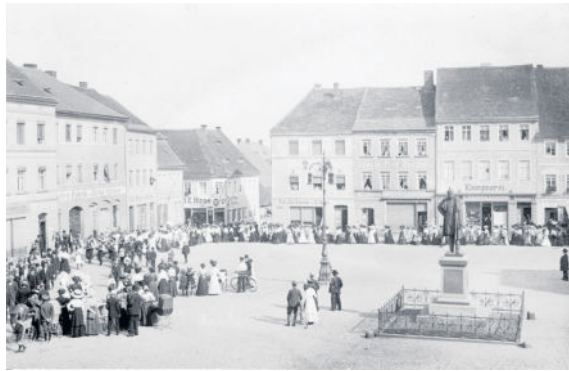
Der Radeberger Markt aus Sicht des Rathauses. Auf diesem Bild sieht man das König Albert Denkmal, welches zwischen 1900 und 1940 auf dem Markt stand.

Städtebaulich hat ein Markt eine große Bedeutung. Im frühen Mittelalter trug die Verleihung des Marktrechtes wesentlich zum Aufschwung der Städte bei. Aus kleinen Dörfern und Ansiedlungen wurden Zentren, Treffpunkte sowie Standorte für Handel und Gewerbe. So hat auch der Marktplatz in Radeberg eine recht bedeutsame Historie. An einem solch zentralen Ort siedelten sich die Menschen an und so entstanden auch der Kleinmarkt sowie die Hauptstraße und einige kleine Nebenstraßen. 1219 findet sich die erste urkundliche Erwähnung von Rade-