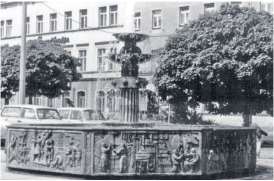
Der von Herbert Viecenz mit Reliefs gestaltete Brunnen ist vielen Radebergern noch in guter Erinnerung. Er wurde 1988 abgebaut.

präsentierte Gerhard Lemm im Stadtrat den Haushaltsplan für die Jahre 2017 und 2018. Darin findet sich unter den Investitionen auch das Budget für einen neuen Marktbrunnen wieder. 350.000 Euro könnten für die Neugestaltung ausgegeben werden. Bis zum Jubiläumsjahr 2019 soll das Projekt umgesetzt werden. Damit hätte das Jubiläumsjahr 2012 das Symbol „Postdistanzsäule“ und das Jubiläumsjahr 2019 den „Marktbrunnen“.