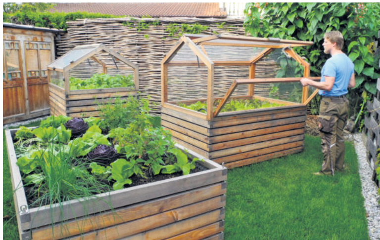
Ernteerfolg garantiert: Mit einem Hochbeet fällt das Gärtnern deutlich leichter.

Ein Hochbeet vereint ganzjährigen Nutzen mit Gärtnern ohne krummen Rücken