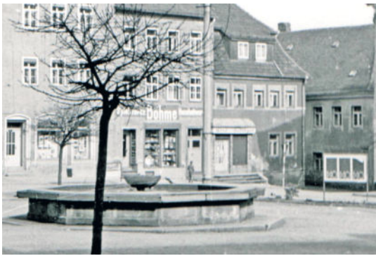
1954-1974 stand dieser schlichte Brunnen auf dem Radeberger Marktplatz.