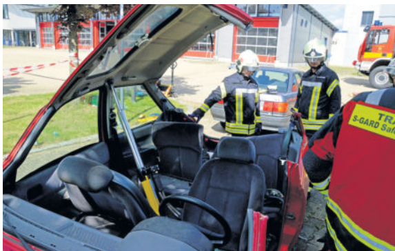
Erkenntnisse, Vorschriften und Vorgehensweisen ändern sich auch bei den Rettungskräften ständig. Um alle Einsatzkräfte auf dem gleichen Sachstand zu halten, sind solche Schulungen und Weiterbildungen sehr wichtig.

schutz beim Einschlagen der Autoscheibe, das Unterlegen von Keilen, damit der Unfallwagen nicht wegrollen kann oder das Auswählen der richtigen Werkzeuge, um Zeitverzögerung zu vermeiden. Das alles ist dann noch in Absprache mit den Rettungsdienstmitarbeitern zu entscheiden. Auch psychologische Feingefühl gehört dazu, um den verletzten Insassen eventuell zu beruhigen oder abzulenken. Zu guter Letzt brauchen Feuerwehrleute auch noch ein paar parentliche Muckis. Denn die Geräte sind teilweise recht schwer, zum Beispiel das Spreizwerkzeug, welches stolze 25 kg wiegt.