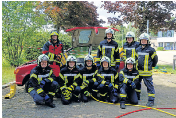
In voller Montur zum Training - im Ernstfall müssen die Kameraden der Freiwilligen Feuerwehr ihr Wissen gekonnt einsetzen.