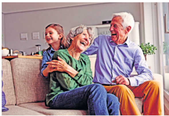
Trotz der neuen Regelungen in der Pflegeversicherung bleibt der private Vorsorgebedarf unverändert hoch. Mit einer Pflegezusatzversicherung ist man im Ernstfall zumindest finanziell abgesichert.

(djd). Am 1. Januar 2017 ist die Reform der sozialen Pflegeversicherung - das Pflegestärkungsgesetz II - in Kraft getreten. Zu den wesentlichen Neuerungen gehört, dass es statt der bisherigen drei Pflegegrade nun fünf sogenannte Pflegegrade gibt. Maßstab für die Einordnung ist nicht mehr die Zeit, die etwa ein Angehöriger oder eine Pflegekraft benötigt, um dem Pflegebedürftigen bei seinen Alltagsaktivitäten zu helfen, sondern der Grad der Selbstständigkeit. Kann der Betroffene noch ohne fremde Hilfe duschen, essen, seine Medikamente einnehmen oder seinen Tag planen? Neu ist auch, dass Menschen mit körperlichen, geistigen und psychischen Beeinträchtigungen künftig einheitlich begutachtet werden. Damit profitieren von der Reform zum Beispiel Demenzerkrankte, die bislang aufgrund ihrer körperlichen Gesundheit nicht als pflegebedürftig galten oder nur eine Einstufung in "Pflegestufe 0" erhielten.