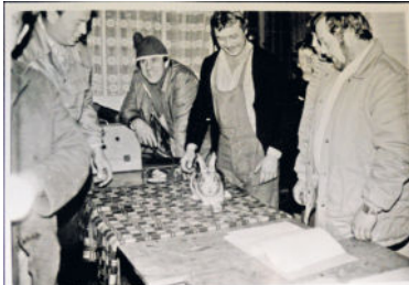
Herbstbewertung Mitte der 80er Jahre