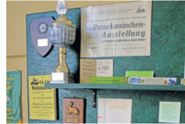
Zahlreiche Auszeichnungen aus 70 Jahren Zuchterfolg

Rassen und kennt sich mit den Langohren bestens aus. In regelmäßigen Abständen wird ausgestellt und bewertet. So auch im Jahr 1957 im 10. Vereinsjahr. Ausschnitt aus der Versammlung vom 19.10.1957: Thema: Vorbereitung der Ausstellung 1957 - Die Leihgebühr der Käfige von der Sparte S643 Radeberg betrug 0,25 DM pro Nummer. - Vom Kreisverband wurden 10m 2 Maschendraht angeboten, dieses Angebot wurde freudig angenommen. Der Preis pro m 2 betrug 4,70 DM.