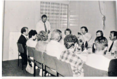
40-jähriges Vereinsjubiläum 1987