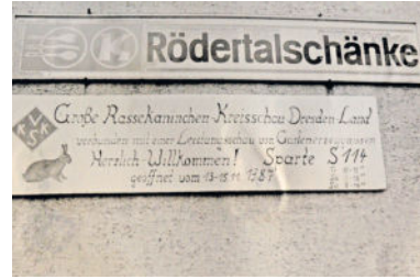
1. Kreisschau 1987