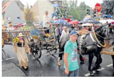
Beim Umzug zum Jubiläumsfest 2012 in Radeberg