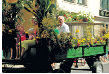
Beim Umzug zum Radeberger Stadtfest 2009