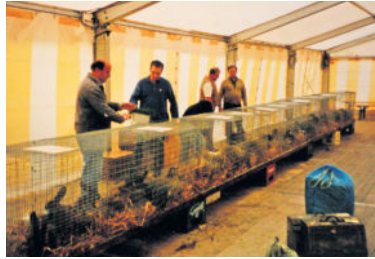
Radeberger Gewerbemesse 1998