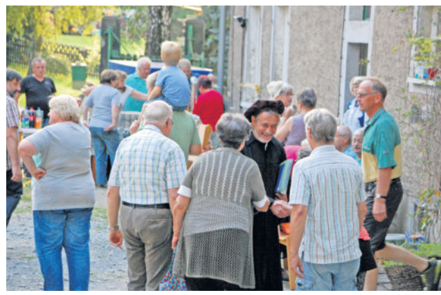
am Sonntag in Fischbach mit einem Gottesdienst. Text & Fotos: Red.