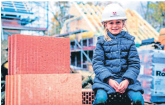
Sicher ans Bauziel: Verbraucherrechte spielen im neuen Bauvertragsrecht ab 2018 eine größere Rolle als bisher.

2-R-Wohnung im DG mit großem Balkon in Radeberg zu vermieten. Tel. 0151 - 142 828 25 www.ipnettd.de - Vermietungen