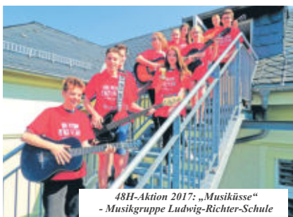
48H-Aktion 2017: „Musiküsse“ - Musikgruppe Ludwig-Richter-Schule