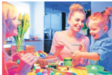
Oster-Basteln mit der Familie macht allen Beteiligten einen Riesenspaß.

gehangen und setzen so bunte Highlights in der immer noch tristen Winterlandschaft. Die ersten Frühblüher sorgen für die ersten Frühlingsgefühle und auch die eine oder andere Knospe traut sich schon ans Licht. Die Vorfreude auf das Osterfest wächst also.