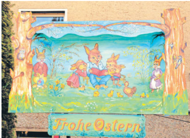
Besonders einfallsreiche und bunte Ostergrüße gibt es momentan in Wallroda zu sehen. Aus Richtung Radeberg kommend, grüßt der Osterhase kurz nach dem Ortseingang auf der rechten Seite.

Das Osterfest läutet den Frühling ein und auch wenn das Wetter nicht gerade mit den ersten warmen Sonnenstrahlen punkten kann, steht besonders bei den Kindern die Suche nach dem begehrten Osternest im Vordergrund. Doch vorher soll natürlich noch bunt geschmückt werden. Ob selbstgemacht oder eingekauft, bei der Osterdekoration sind fast keine Grenzen gesetzt. Im Trend liegt aktuell ganz stark „Do it yourself“ als Selbstgemachtes. Gebastelt werden kann vor allem mit den Kindern und so kann auch ein verregener Tag zum kunterbunten Erlebnis werden. Draußen werden die bunten Ostereier an die Bäumchen