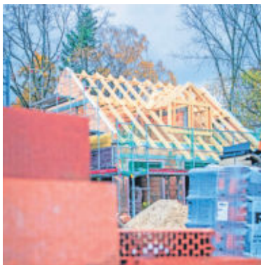
Seit Anfang 2018 gilt das neue Bauvertragsrecht, das zum Beispiel durch klare Regeln zur Baubeschreibung Verbraucherrechte besser schützt.

übergeben, etwa die Genehmigungsplanung, EnEV- oder KfW-Nachweise. So können Verbraucher die Informationen durch einen unabhängigen Sachverständigen prüfen lassen. Der BSB empfiehlt zusätzlich, die Übergabe weiterer sinnvoller Dokumente wie Prüfprotokolle der Elektronanlage und Nachweise über Baugrundgutachten vertraglich festzulegen. Infos und unabhängige Rechtsberatung gibt es unter www.bsb-ev.de .