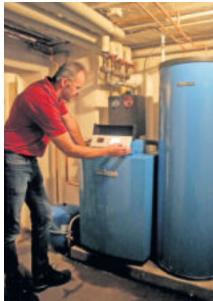
txn. Spart Ärger und Geld: Die jährliche Wartung der Heizungsanlage sollte für jeden Hausbesitzer ein fester Termin im Kalender sein.