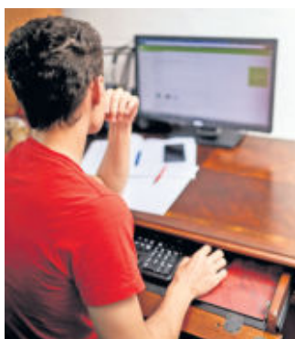
txn. Bewerber sollten in die richtige Zusammenstellung ihrer Online-Unterlagen so viel Zeit investieren wie in die klassische Papier-Bewerbung.

txn. Nur noch jeder vierte Arbeitgeber bevorzugt laut einer Umfrage des Digitalverbands Bitkom heute eine klassische Bewerbung. Und das hat gute Gründe: „Online-Bewerbungen verursachen deutlich weniger Aufwand und sind für Personalverantwortliche einfach zu verwalten“, sagt Petra Timm vom Personaldienstleister Randstad. „Für den Bewerber hat es den Vorteil, dass die E-Mail sofort beim potenziellen Ausbildungsbetrieb ankommt.“ Doch es gibt dabei einiges zu beachten.