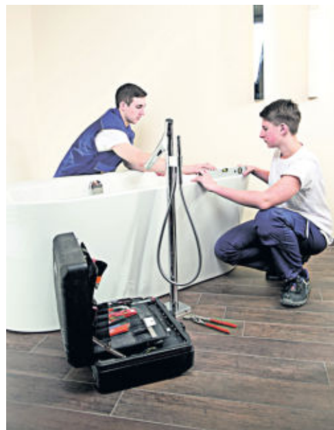
Empfehlenswert vor der Ausbildung: Im Rahmen eines Schülerpraktikums kann zum Beispiel der Beruf des Anlagenmechanikers kennengelernt werden. Außerdem lässt sich dadurch prüfen, ob der Arbeitsalltag den eigenen Erwartungen entspricht.