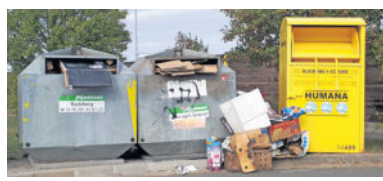
Am Eschenweg in Radeberg wird regelmäßig illegal Müll entsorgt. Nach mehrmaligen Hinweisen an die Stadtverwaltung wurde dieser nun beraumt, das Entsorgungsunternehmen leerte lediglich die Container. Die Anwohner hoffen nun, dass regelmäßig geleert, kontrolliert und abgemahnt wird.

Eine weitere Frage bleibt natürlich auch unbeantwortet. Am Beispiel gezeigter Fotos liegt der illegale Müll schon seit über 3 Wochen neben den Papiercontainern. Die Stadtverwaltung stört dieser Zustand offensichtlich nicht, denn mit dem Warnschild und den Strafanordnungen hat sie wahrscheinlich ihre Möglichkeiten zur Genüge ausgeschöpft. Gesetze laut Polizeiverordnung schaffen ist die eine Seite. Die Kontrolle der Einhaltung mit den nötigen Strafmaßnahmen wäre die andere Seite. Da nimmt man es lieber in Kauf, dass engagierte Bürger, wie eine 80-jährige Frau am 04.10.2018, mit Handgreiflichkeiten und Prügel bedroht wird, nur weil sie am heller lichten Tag illegale Müllentsorger auf ihr Fehlverhalten hingewiesen hat.