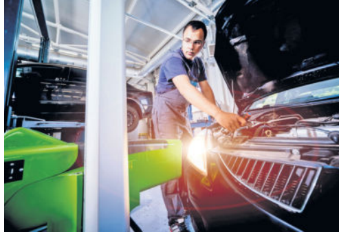
tn. In der dunklen Jahreszeit ist die einwandfreie Funktion der Beleuchtung am Auto besonders wichtig. Viele Kfz-Werkstätten bieten im Oktober einen kostenlosen Lichttest an.

Wer seine Augen regelmäßig kontrollieren lässt, leistet einen wichtigen Beitrag für die Sicherheit im Straßenverkehr.