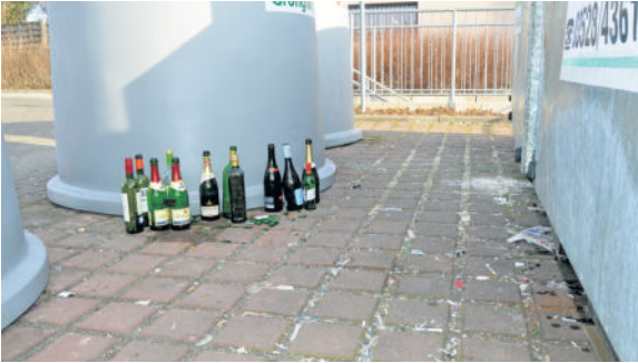
Nicht nur an den Containern am Eschenweg in Radeberg wird illegal Müll abgeladen. Auch in anderen Stadtteilen sind die Container kein schöner Anblick und Ablagestelle für jegliche Art von Müll. Zum Beispiel auf dem Parkplatz an der Oberstraße (oben) oder an der Röderstraße (unten). Letzterer an der Mittelmühle wurde nun im Zuge der Straßensanierungsarbeiten ersatzlos gestrichen.