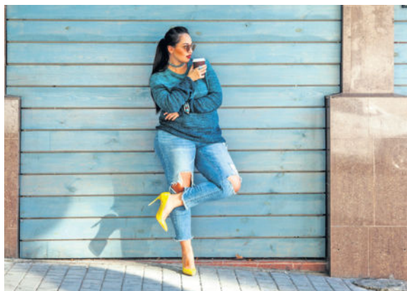
txn. Mit einfachen Styling-Regeln können kurvige Frauen selbst bestimmen, wie sie ihren Körper betonen möchten. Dank der neuen Curvy-Linien wird es immer leichter, die passende Kleidung zu finden.