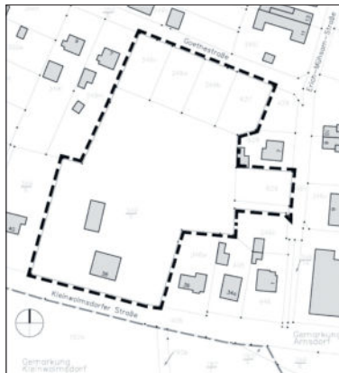
Übersichtsplan Geltungsbereich Bebauungsplan „Wohnbebauung Goethestraße / Erich-Mühsam-Straße“ Arnsdorf

Der Gemeinderat von Arnsdorf hat in seiner Sitzung am 19.09.2018 den Beschluss zur Aufstellung des Bebauungsplans „Wohnbebauung Goethestraße / Erich-Mühsam-Straße“ gefasst. Die innerörtliche Gewerbebrache soll zurückgebaut und einer sinnvollen städtebaulichen Nachnutzung zugeführt werden. Planungsziel ist die Einordnung von Wohnbebauung. Der Geltungsbereich des Bebauungsplanes umfasst eine Fläche von insgesamt 1,0 ha. Betroffen sind die Flurstücke 349/5, 349v, 349w, 349b, 627 und 629 der Gemarkung Arnsdorf.