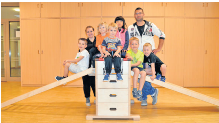
Die Kinder der Kita „Am Sandberg“ bedanken sich herzlich bei den Heinrichsthaler Milchwerken für diese Unterstützung.

Seit der Eröffnung der Kita „Am Sandberg“ in Radeberg im Jahr 2013, steht wöchentlicher Sport bei den Kindern weit oben auf dem Programm.