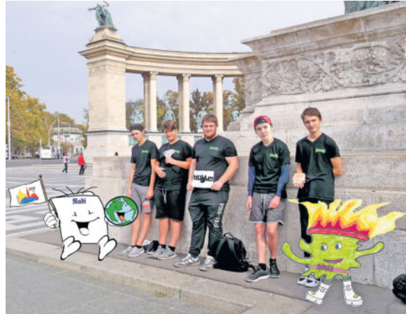
Also, wir sehen uns doch im städtischen JC auf der Schillerstraße 72 a in Radeberg? Die Spläshis