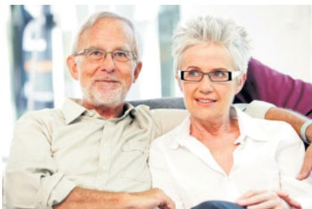
Brillen liefern den Augen die nötigen Dioptrien, die der natürlichen Akkommodation bei Alterssichtigkeit fehlen. Darüber hinaus wirken sie oft auch als modisches Accessoire.

Wenn die Linse verhärtet, wird das Sehen anstrengend Dieses Spiel aus Aufwölben und Abflachen betreibt die Linse den lieben langen Tag, ohne dass wir es merken. Bis dann das vierte Lebensjahrzehnt da ist. Mit Mitte 40 hat die Augenlinse bei den meisten Menschen ihre Elastizität so weit verloren, dass das Nahsehen nicht mehr anstrengungsfrei möglich ist. Nun sind optische Hilfsmittel, wie zum Beispiel eine Lesebrille, erforderlich.