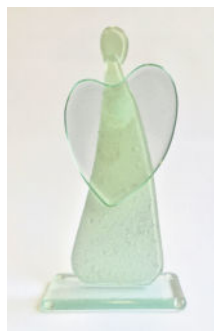
Die Lebensspuren des Verstorbenen scheinen zu glitzern, die Flügel des Engels bilden ein dezentes Herz. Mit seinen runden Formen ist der Engel aus der Glasmanufaktur einer Schweizer Künstlerin eine sanfte Erinnerungsskulptur.

Eine moderne Form des Gedenkens sind Erinnerungskristalle oder Gedenkskulpturen. Bei diesen wird ein geringer Teil der Kremationsasche in eine Glasskulptur eingeschmolzen und geht mit ihr eine Einheit ein. Auf diese Art entstehen etwa bei der Immer & Ewig AG in der Schweiz Objekte, Figuren und Formen. Diese können entsprechend ihrer Größe zu Hause aufgestellt oder am Körper getragen werden. Die verbleibende Asche wird ohne Urne in der freien Natur beigesetzt. Der Waldfriedhof Pax Montana befindet sich in einem abgelegenen Waldstück im Schweizerischen Poschivao, inmitten der Schweizer Alpen im Kanton Graubünden. Die Angehörigen erhalten eine Urkunde mit dem genauen Ort und Zeitpunkt der Ascheausstreue. So kann der Beisetzungsort stets besucht werden. Die Naturbestattung ist im Preis für die Skulpturen inbegriffen. Der große Vorteil einer Naturbestattung für die Angehörigen: Der Aufwand für Grab, Grabstein, Grabmiete und Grabpflege entfällt komplett.