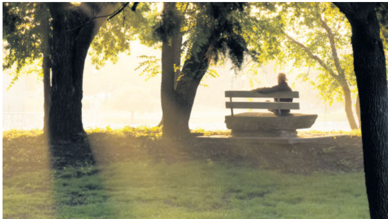
Mehr als sonst richten sich im Trauermonat November die Gedanken auf das Ende des Lebens.

(djd). Im Trauermonat November richten sich mehr als sonst die Gedanken auf das Ende des Lebens. Zur Tradition zählt für viele ein Besuch des Friedhofs: Ein schön geschmücktes Grab drückt die Verbundenheit zum Verstorbenen aus. Immer wichtiger wird den Menschen allerdings heute, dass das Gedenken an einen Toten nicht zur Routine wird, sondern dass die Form der Bestattung das Besondere des Verstorbenen widerspiegelt.