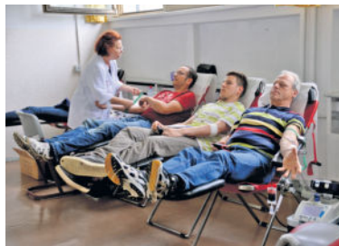
Seit vielen Jahren ist die Arnsdorfer Plattenbauschule ein beliebter Anlaufpunkt für die Blutspende. Durch die liebevolle Organisation des DRK-Ortsverband wird die Aktion zum Treff, mit Plausch und der Spende für den guten Zweck.

Mit einer Blutspende starten Sie als Lebensretter ins neue Jahr. Denn aus dem halben Liter einer Vollblutspende werden drei Präparate gewonnen, die für viele Patienten überlebenswichtig sind. Für den Spender selbst bedeutet die Blutspende eine Vorsorge für die eigene Gesundheit. Nur ein Beispiel: Vor jeder Blutspende wird unter anderem der Hämoglobinwert des potentiellen Spenders bestimmt. Das Hämoglobin ist ein Protein der roten Blutkörperchen (Erythrozyten). Da es dem Blut seine rote Farbe verleiht, wird es auch als roter Blutfarbstoff bezeichnet. Die wichtigste Aufgabe des Hämoglobins ist die Versorgung der Körperzellen mit lebenswichtigem Sauerstoff. Um eine Blutspende leisten zu können, muss der von der Spende gemessene Hämoglobinwert bei Männern > 13,5 g/dl (Gramm pro Deziliter) sein, bei Frauen > 12,5 g/dl.