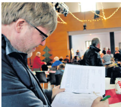
Beim Straßenweihnachtsmarkt wurde die Unterschriftensammlung gestartet. Die Initiative ist begeistert, insgesamt hatten 150 Marktbesucher unterschrieben. Noch bis zum 18. Januar liegt die Petition in den Langebrücker Geschäften aus.

Unter der Federführung des Langebrücker Andreas