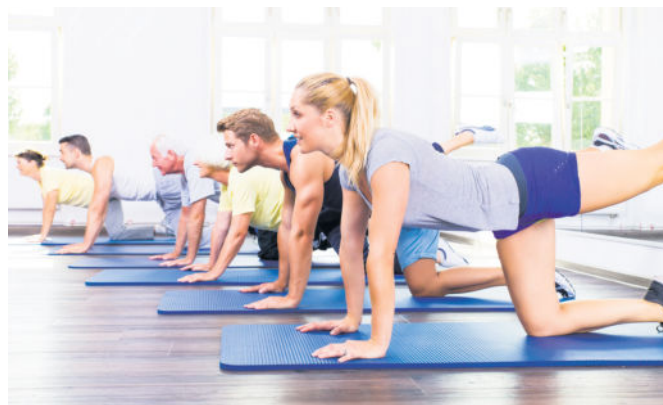
txn. Ausreichend Bewegung ist gesund und macht fit.