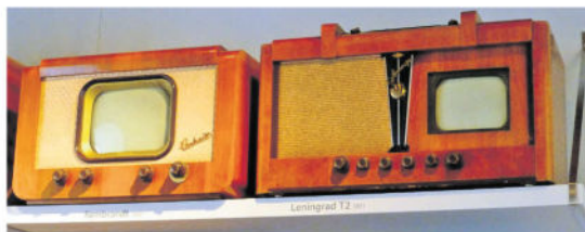
Fernsehgeräte „Leningrad T2“ (re.) und das Nachfolgergerät „Rembrandt“ in der Industrierausstellung Schloss Klippenstein Radeberg.

völlig neu und viel zu faszinierend. Wie die grauen Bilder auf die reichlich postkartengroßen Bildschirme der wenigen damals in Berlin verkauften, oder besser: zugeteilten, Fernseh-Radio-Geräte vom Typ