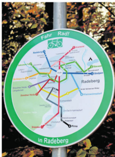
Am Ortsausgang Liegau-Augustusbad in Richtung Langebrück ist dieses Schild zu finden. Hier sind derzeit alle verfügbaren Radwege rund um Radeberg aufgeführt. Gern würden Liegauer und Langebrücker das Schild um den lang ersehnten Radweg entlang der S180 zwischen beiden Orten ergänzen.

Wenn gebaut werden kann, ist derzeit noch vollkommen offen. Aber in der Öffentlichkeit kursieren immer wieder die Jahre 2020/2021 als mögliche Ziele in puncto Baustart. Bevor das möglich ist, müssen erst einmal die benötigten Flächen von den privaten Eigentümern erworben werden.