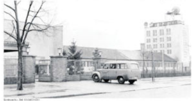
Das neu erbaute Fernseh-Sendezentrum der DDR in Berlin-Adlershof.

Solche Geschenke machte man öfters: Bereits für das Jahr 1951 ist das Sachsenwerk Radeberg mit der Fertigung von 30.000 Fernsehgeräten beauftragt worden. Im Rahmen einer Betriebsverpflichtung wurde dann der Plan für 1951 auf 40.000 Geräte erhöht. Die gesamte Produktionsmenge war als Reparationsleistung an die Sowjetunion zu liefern. Jedoch konnten davon ca. 10.500 Geräte wegen Qualitätsmängeln (fehlerhaftes Zuliefer-Material) erst 1952, zusätzlich zur Planung, ausgeliefert werden. An einen Bedarf für die DDR war noch nicht zu denken, weil es