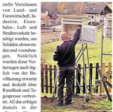
Eine der unzähligen Mess-Stationen, ein „Wetterhäuschen“

mussten, und diese dann mit den Meldungen der Wetterbeobachter zusammenzuführen. Keiner sah die Zeichner der Wetterkarten und schließlich die Redakteure der Wetterberichte oder Vorhersagen, die als unabkömmliche spe-