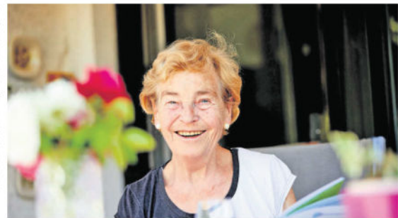
Viele Senioren würden ihre Nachkommen gerne finanziell unterstützen. Doch häufig fehlt es dafür an Geld. Eine Lösung für mehr finanziellen Spielraum im Alter kann die Immobilien-Leibrente sein.

An einem Musterbeispiel wird deutlich, wie sich die Immobilien-Leibrente rechnet. Ein Paar, beide 75 Jahre alt, besitzt ein Eigenheim, sein Wert beträgt 300.000 Euro. Wird die Immobilie im Rahmen einer Immobilien-Leibrente verkauft, beträgt der rechnerische Wert des mietfreien Wohnrechts