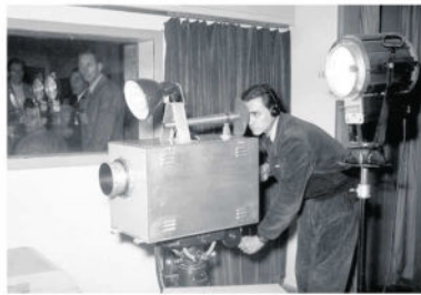
Eine der ersten DFF-Studio-Kameras 1952.

Beim deutschen Fernseh-Sende-Start war die DDR Sieger – in der Bundesrepublik begann das Sendeprogramm am 25. Dezember 1952 als „Nordwestdeutscher Rundfunk-Fernsehen“. Und ein zweiter, nicht weniger wichtiger Grund war ausschlaggebend für den Zeitdruck: der 74. Geburtstag von J. W. Stalin am 21. Dezember 1952. Und so, wie man Siegern ja schon immer gerne Geschenke machte, war der erste öffentliche deutsche Fernsehsender das Geburtstagsgeschenk der DDR an den großen Generalissimus Stalin und die Sieger- und Besatzungsmacht Sowjetunion.