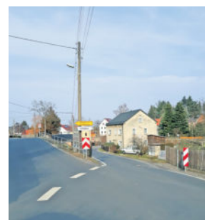
Die Kreuzung ist nicht mehr zeitgemäß.