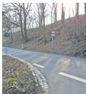
Die Straße ist zu schmal.

Es wird sich zeigen, ob es zu den hier aufgeworfenen Fragen in Kürze eine infrastrukturelle sinnvolle Antwort gibt, geb