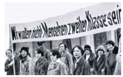
Frauen-Demonstration in den 1960er Jahren in der BRD.