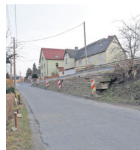
Seit 2012 existiert das Betonprovisorium.