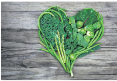
Grüne Gemüse sind wertvolle Vitamin K-Quellen.

Den Namen hat das Vitamin K von seiner wichtigsten Funktion, der Blutgerinnung (lat. Koagulation). Es fördert den Aufbau von Gerinnungshemmern in der Leber und beeinflusst die Fließeigenschaften des Blutes. Darüber hinaus spielt es aber auch eine entscheidende Rolle beim Knochenaufbau und, wie jüngere Forschungen zeigen, in der Prophylaxe von Diabetes. Eine niederländische Studie mit rund 38.000 erwachsenen Teilnehmern deutet darauf hin, dass eine gute Versorgung mit Vitamin K vor Diabetes mellitus schützen könnte. Im Körper aktiv ist das Vitamin in der umgewandelten Form K2.