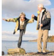
Wer im Alter aktiv bleibt, kann Schwindel leichter die Stirn bieten.