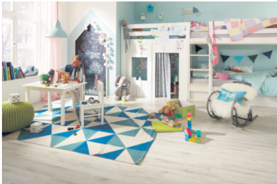
Bioboden-Kinderzimmer-1: wohngesund, strapazierfähig, pflegeleicht - der elastische Bodenbelag ist ideal fürs Kinderzimmer.

Der mehrfach zertifizierte und ausgezeichnete Purline Bioboden eignet sich in Kombination mit einer Fußbodenheizung ideal fürs Kinderzimmer. Authentische Holzdekore sorgen auch optisch für Behaglichkeit. Der Belag ist leicht zu verlegen, es gibt ihn zum Kleben oder auch zum Klicken. Weitere Informationen unter www.wineo.de.