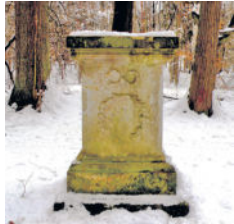
Altar der Tugend

der Weg und nahe der Röder passiert man die „LINDE DER RUHE“ mit den seitlichen Erdbänken. Im April/Mai kann man die gemeine Schuppenwurz, ein vollparasitärer Frühlingsblüher, hier bewundern. Seit einigen Jahren hat sich hier eine kleine, vielleicht die einzige Röderinsel gebildet. Die Röder, gebremst durch die westlich gelegene Felsenwand, bildet hier einen etwa 90°- Bogen und fließt weiter zu