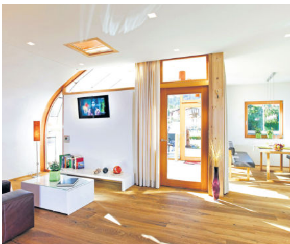
Plastikfreier-Tonspachtel 1: Der rein mineralische Tonspachtel für die Wand ist wohngesund und garantiert plastikfrei.

(pr-jaeger) Die Problematik Plastikmüll und Mikroplastik ist in aller Munde. Die wenigsten denken dabei aber auch an ihr direktes Wohnumfeld. Doch nahezu alle gängigen Wandbeschichtungen enthalten nicht deklarierte Silikone. Das ist erst ab einem Anteil von vier Prozent Pflicht. Mit dem neuen Prüfsiegel „Ohne Plastik“ will die Deutsche Gesellschaft für Umwelt- und Humantoxikologie (DGUHT) gewährleisten, dass Produkte, die als wohngesund und ökologisch gelten, wirklich frei von Kunststoffen in jeglicher Form sind. Die ersten drei Produkte sind bereits zertifiziert worden, darunter ein Tonspachtel von Emoton. Silikon wird in