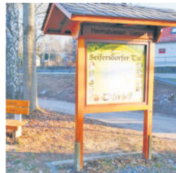
Infotafel zum Tal

turen und selbst die Farben der Landschaft sehr gut zur Darstellung. Zum Schluss seien mir zwei Bemerkungen noch erlaubt: Erstens, das Tal ist nicht nur von der kunsthistorischen Seite sehr bemerkenswert, sondern zeigt uns auch eine besondere botanische Vielfalt. Als