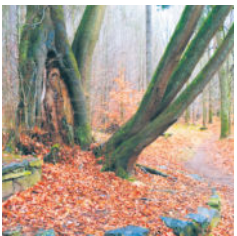
Linde der Ruhe

der Weg und nahe der Röder passiert man die „LINDE DER RUHE“ mit den seitlichen Erdbänken. Im April/Mai kann man die gemeine Schuppenwurz, ein vollparasitärer Frühlingsblüher, hier bewundern. Seit einigen Jahren hat sich hier eine kleine, vielleicht die einzige Röderinsel gebildet. Die Röder, gebremst durch die westlich gelegene Felsenwand, bildet hier einen etwa 90°- Bogen und fließt weiter zu