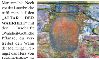
Altar der Wahrheit

Es handelt sich um einen Roman des 18. Jh. (erschienen 1768), der damals sehr gern gelesen wurde und den man heute für die damalige Zeit durchaus als Bestseller bezeichnen kann. Der Übersetzer des Romans, Joachim Christoph Bode (1730-1793) folgte dem Rat Gotthold Ephraim Lessings „sentimental“ mit „empfindsam“ zu übersetzen. Der Dichter, Lawrence Sterne, wurde von J. W. v. Goethe und besonders von Friedrich Nietzsche sehr verehrt. Nach dem Überqueren der Laurabrücke, früher „Schwarze Brücke“, treffen wir auf die LAURASÄULE . Sie erinnert an die platonische Liebe des italienischen Renaissancedichters, Francesco Petrarca (1304 - 1374). Er