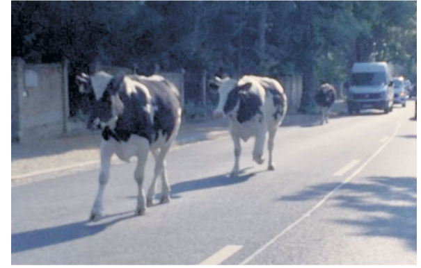
Tierische Begegnung am 26. Juni.