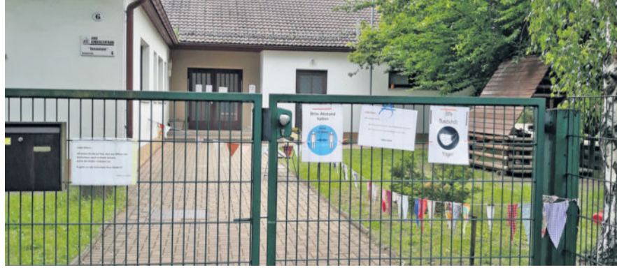
Mit dem Umzug ins neue Kinderzentrum sollte der Kindergartenbau in der Bruhmstraße abgerissen werden, auf der Fläche sollen Parkplätze entstehen. Das Projekt und ein weiteres sind nun ins Jahr 2021 verschoben.

Zur Erinnerung: Auf dem Grundschulareal planen die Langebrücker den Bau einer Zweifeldturnhalle. Dafür wird die bisherige Turnhalle abgerissen, an gleicher Stelle soll der Neubau entstehen. Darüber hinaus wird der benachbarte Kindergartenflachbau in der Bruhmstraße abgerissen, auf der Freifläche werden Parkplätze entstehen.