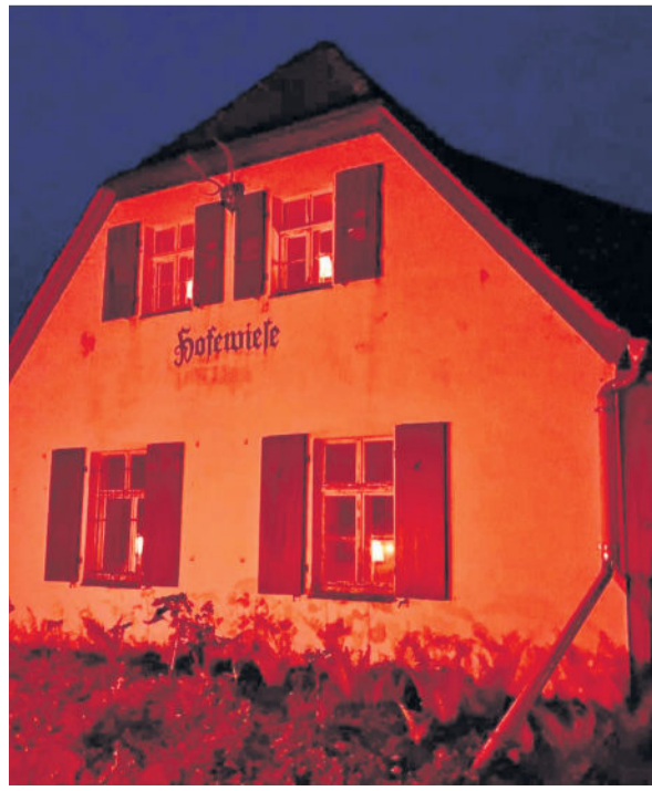
Wie zahlreiche Gebäude in Dresden erstrahlte auch die Hofewiese in rotem Licht.

Für die Veranstaltungsbranche sind die Auswirkungen der Corona-Krise bis heute spürbar. Zahlreiche Veranstaltungen wurden abgesagt oder sind nur unter strengen Auflagen möglich. Um ein sichtbares Zeichen zu setzen, gab es in der Nacht vom 22. auf den 23. Juni nun die Aktion „Night of Light“. Bundesweit erstrahlten unzählige Gebäude in rotem Licht. „Mit dem Fernsehturm oder der Brühlschen Terrasse konnten wir zwar nicht mithalten, aber auch die Hofewiese hat sich an der Protestaktion beteiligt“, heißt es auf der Facebookseite der Hofewiese. Fakt ist, die behördlichen Einschränkungen infolge der Corona-Krise haben auch hier Auswirkungen auf die Anzahl der Plätze und das Angebot. „Insgesamt sieht aber alles so aus wie früher. Wir haben ja viel Platz unter freiem Himmel“, gibt sich Inhaber Holger Zastrow optimistisch. So konnte am vergangenen Wochenende das beliebte Erdbeerfest gefeiert werden.