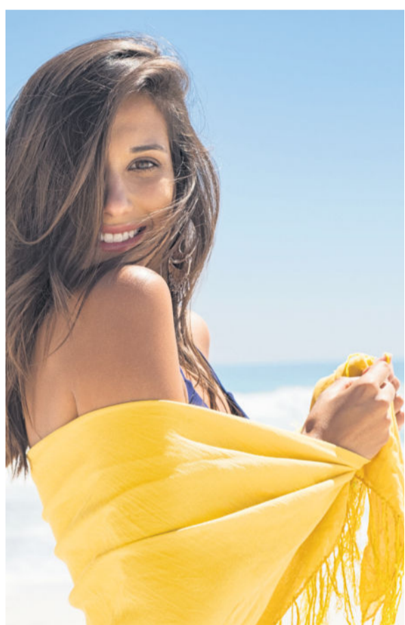
Im Sommer setzt vor allem die UV-Strahlung der Körperhülle zu - sie kann die Kollagenfasern in der Haut schädigen.