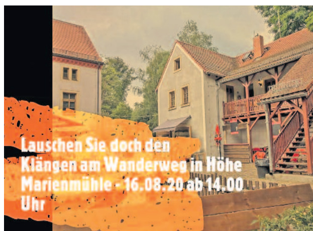
So wirbt der Chor fürs Open-Air-Singen.

sie auch das Publikum mit ihrem Gesang erfreuen. Deshalb hat sich die 1. Vorsitzende Simone Lehmann etwas Besonderes überlegt. Ein toller, neuer Konzertansatz, der hoffentlich den einen oder anderen erreicht. Alle Interessierten können sich den Sonntag, 16. August, schon einmal im Kalender vor-