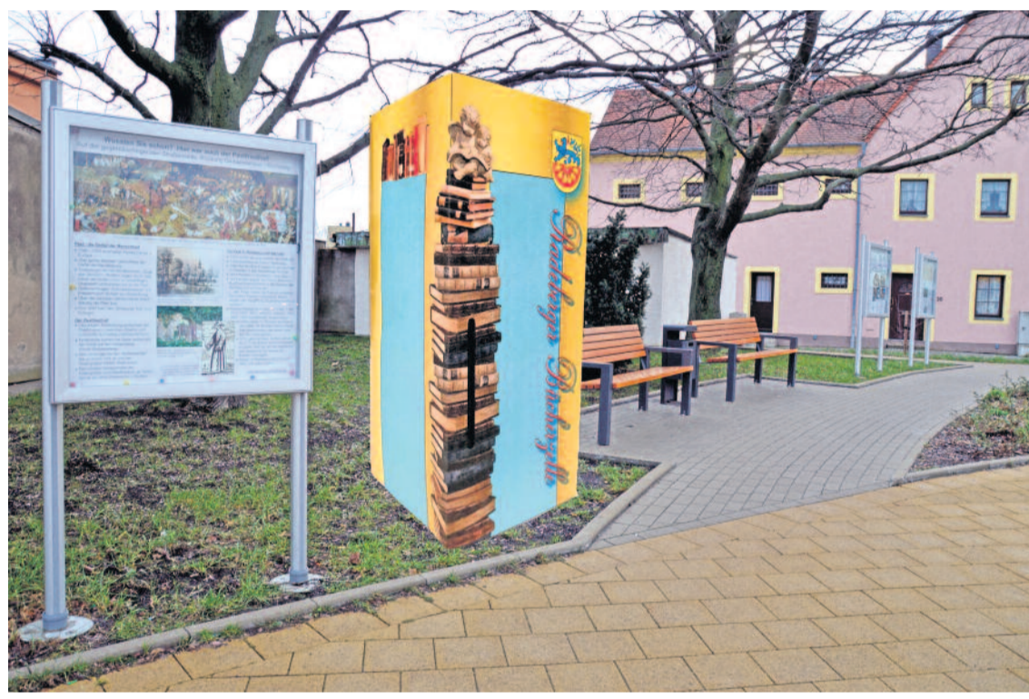
An der Ecke Pulsnitzer Straße / Oberstraße soll die Bücherzelle zwischen den Schaukästen und den Sitzbänken ihren Platz finden und zum Schmökern einladen.

Nachdem die Idee einer Radeberger Bücherzelle bereits Ende 2019 über mehrere Medienkanäle verbreitet wurde, bekam die Initiatorin nun über den Jahreswechsel jede Menge Zulauf und Hilfsangebote. So wird es der AWO Regionalverband Radeberger Land e.V. sein, der quasi die Trägerschaft für das Projekt übernimmt. Anfang des Jahres kam auch die Bestätigung aus dem Rathaus, die für die Beschaffung und den Transport der alten Telefonzelle aufkommen wird.