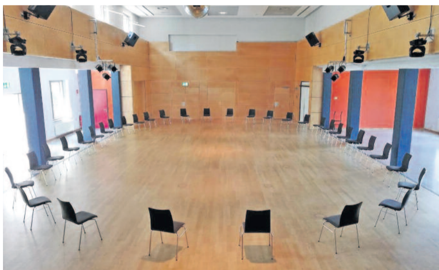
So sieht es jetzt vor der Chorprobe im großen Saal des Bürgerhauses aus. Der Abstand muss auch hier eingehalten werden.