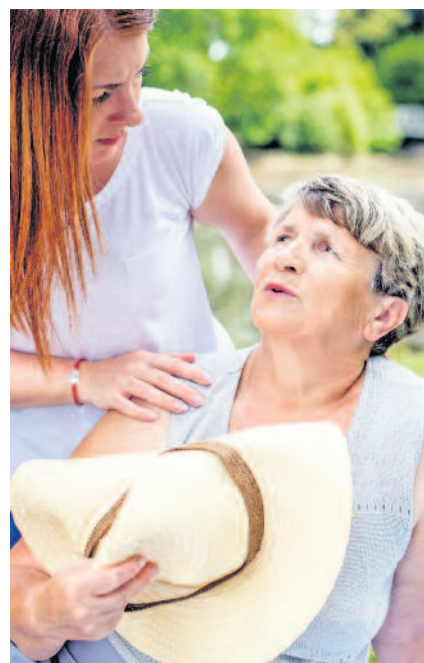
Durchblutungsstörungen etwa durch Arteriosklerose oder Bluthochdruck können Schwindel fördern. Ältere Menschen sind deshalb häufiger betroffen.

stunden - und eine leichte Kost mit viel Obst und Gemüse fördern. Auch bestimmte Nährstoffe können den Kreislauf in Schwung bringen, zum Beispiel der natürliche Eiweißbaustein Arginin - Informationen dazu unter www.telcor.de . Aus Arginin wird im Körper ein Botenstoff gebildet, der die Gefäße weitet und vor Ablagerungen schützt. Dass sich das auch auf die Vitalität auswirkt, wurde in einer produkt-eigenen Studie mit dem Prüfpräparat Telcor Arginin plus belegt: Patienten, die über einen Zeitraum von mindestens drei Monaten die Kombination aus L-Arginin und B-Vitaminen eingenommen hatten, gaben an, sich deutlich fitter zu fühlen. Besonders für Menschen mit Arteriosklerose, Bluthochdruck und Diabetes ist eine zusätzliche Aufnahme sinnvoll, so der Bochumer Kardiologe Dr. med. Hans-Joachim Christofor: „In meiner Praxis empfehle ich Patienten häufig eine Kombination aus Arginin und B-Vitaminen, zum Beispiel Telcor Arginin plus aus der Apotheke. Es verbessert sich die Durchblutung und die Hitze macht im Regelfall weniger zu schaffen.“