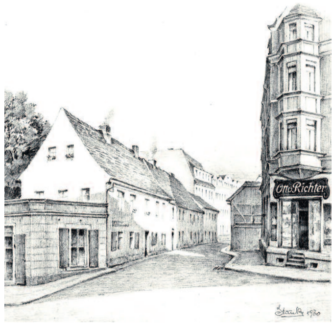
- Karl Stanka gr.000.183, 1930, Neue Straße Ans. 2 Von Karl Stanka - Museum Schloss Klippenstein, CC BY-SA 4.0, https://commons.wikimedia.org/w/index.php?curid=83138825

„Weißt du noch damals, als...?“ Oft hört man diesen Satz, wenn es um das Stadtbild Radebergs geht. Es hat sich vieles verändert, größtenteils positiv, wenn man sich den Zustand der Innenstadt nach der Wende ins Gedächtnis ruft. Wie es in unserer Stadt vor rund 100 Jahren aussah, zeigen uns beispielsweise die Werke von Karl Stanka. Der Maler-Chronist hat die Stadtansichten festgehalten und fleißige Chronisten