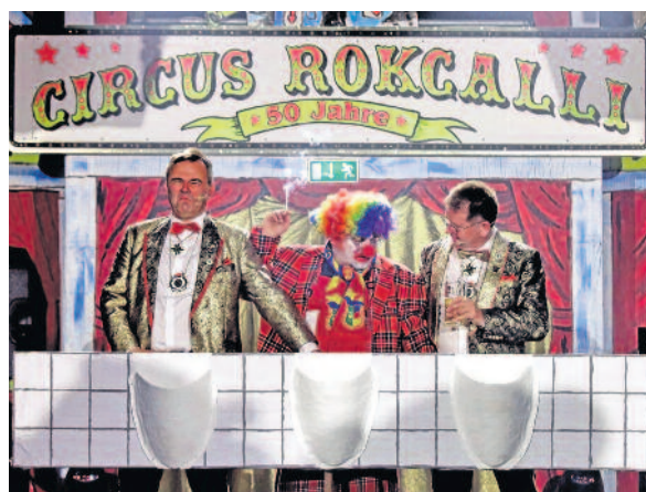
Wie die Mitglieder auf den Namen des Circus kamen, ist nicht genau überliefert. Doch wir erfuhren, dass die beiden Namen ZirkusKAPPE und RokCalli zur internen Wahl standen.