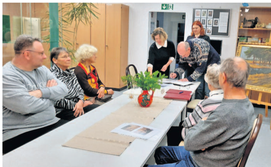
Unterzeichnung der Schenkungsurkunde.