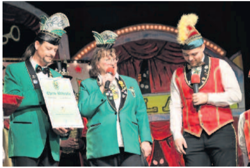
Der Verband Sächsischer Carneval e.V. überreichte mehrere Auszeichnungen an Vereinsmitglieder und natürlich auch an den KCA selbst zum 50-jährigen Bestehen.

folgt nun eine Veranstaltung nach der nächsten. Die Arnsdorfer genießen ihre 50. Saison, die eigentlich genau genommen nicht ganz die 50. ist. Doch was sich dahinter verbirgt, erfahren Sie zum Ende der Karnevalssaison in Ihrer Heimatzeitung „die Radeberger“. Wer dem Karnevalsclub Arnsdorf