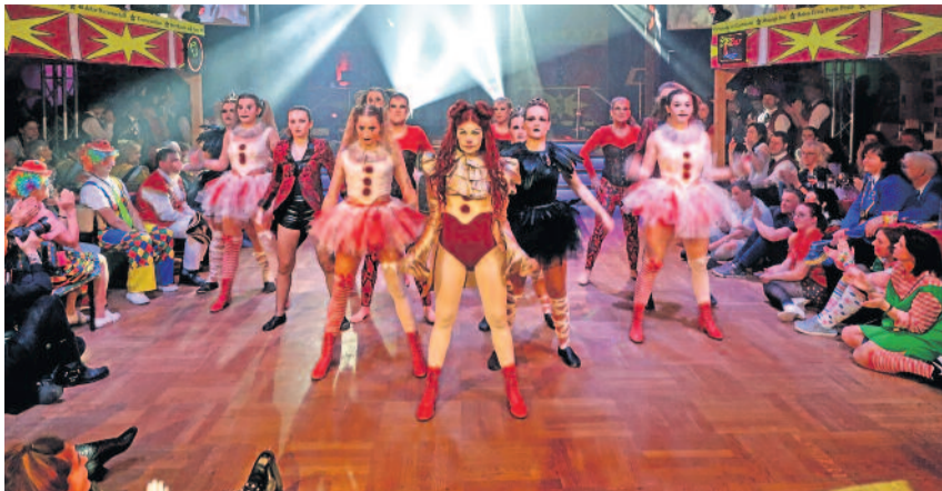
Endlich kann wieder ohne Einschränkungen getanzt und gefeiert werden. Auch für die Funkengarde des KC Arnsdorf ist es ein kreativer Befreiungsschlag.

Was für ein Abend, was für eine Nacht! Nachdem im November bereits in die neue Faschingsaison 2022/23 gefeiert wurde, legten die Karnevalisten in Arnsdorf nun richtig los. Am Freitag, dem 03.02.2023 lud der Verein zur Jubiläumsveranstaltung ein. Der 50. Geburtstag sollte ausgiebig gefeiert werden und so geschah es auch. Das rauschende Fest nahm seinen Anfang mit einem Sektempfang pünktlich 19.11 Uhr. Eingeladen waren ehemalige Prinzenpaare und Mitglieder sowie Unterstützer und Sponsoren, aber auch befreundete Karnevalsvereine aus der Region. So ließen es sich immerhin 24 Faschingsvereine nicht