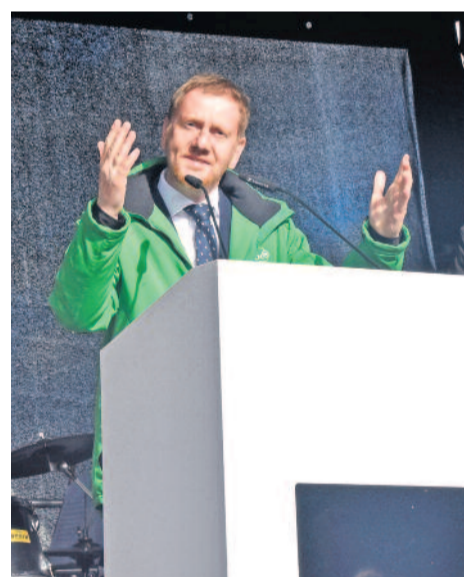
„Die Dresdner Ostumfahrung ist ein bedeutendes Infrastrukturvorhaben für die gesamte Region“, erklärte Ministerpräsident Michael Kretschmer in seiner Ansprache.

Daten und Fakten zum Vorhaben Im September 2017 fand der feierliche Baubeginn für den Neubau der Ortsumgehung Leppersdorf statt. Das Projekt umfasst den Neubau der S 95 (S 177) zwischen Radeberg und der A 4 auf einer Länge von 5,3 Kilometern. Zur Anbindung an die A 4 wurde eine neue Anschlussstelle errichtet, die bestehende Anschlussstelle Pulsnitz wird zurückgebaut. Weiter nördlich erfolgte der Anschluss an die bestehende S 95 auf einer Länge von weiteren rund 1,4 Kilometern. Die Gesamtbaukosten belaufen sich auf rund 65 Millionen Euro.