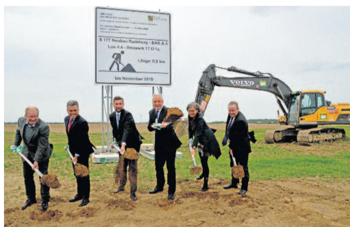
Am 08. September 2017 erfolgte der 1. Spatenstich für die Ortsumgehung.

In der ersten Hälfte der Bauzeit wurden die Ingenieurbauwerke einschließlich der Regenrückhaltebecken und Hochwasserschutzanlagen hergestellt. Insgesamt befinden sich entlang der gesamten Baustrecke 14 Ingenieurbauwerke unterschiedlicher Bauart. Drei dieser Brückenbauwerke dienen als Querungshilfen und damit dem Schutz von Fledermäusen. Darüber hinaus wurden vier Regenrückhaltebecken und 16 Durchlässe für Amphibien und Fischotter errichtet. Eine Besonderheit stellen die beiden Hochwasserschutzbauwerke dar. Diese wurden in den Straßendamm integriert und schützen die Gemeinde Wachau vor zukünftigen Hochwässern. Insgesamt wurde für die Gewässer „Fauls Floß“ und „Kleine Röder“ ein Hochwasserrückhaltevolumen von ca. 100.000 m 3 geschaffen. Betrieben werden die Anlagen von der Gemeinde Wachau.