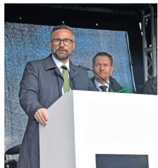
Martin Dulig, Staatsminister für Wirtschaft, Arbeit und Verkehr erklärte: „Mit der Fertigstellung der Ortsumgehung Leppersdorf sind wir der Gesamtfertigstellung wieder ein großes Stück näher gekommen.“