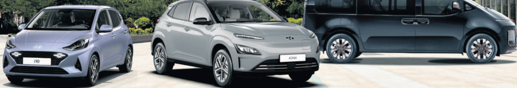
Abb. zeigen Sonderausstattung