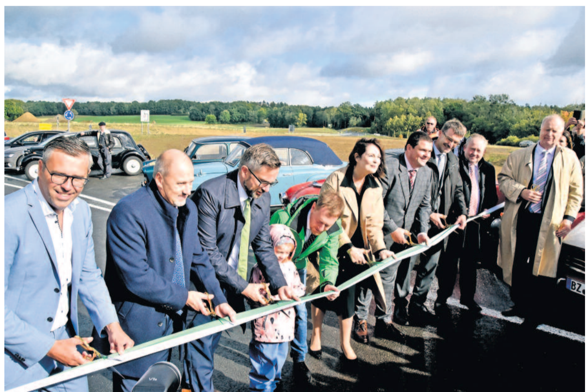
„Man kann nicht in die Zukunft schauen, aber man kann den Grund für etwas Zukünftiges legen - denn Zukunft kann man bauen“, sagte einst der französische Schriftsteller Antoine de Saint-Exupéry. Mit einem symbolischen Banddurchschnitt wurde das Bauprojekt offiziell abgeschlossen.

„Mit der Fertigstellung der Ortsumgehung Leppersdorf sind wir der Gesamtfertigstellung wieder ein großes Stück näher gekommen. In den Neubau der Ostumfahrung hat der Freistaat bereits 200 Millionen Euro investiert, mit der Fertigstellung der beiden noch ausstehenden Abschnitte werden es voraussichtlich rund 300 Millionen Euro sein“, so Verkehrsminister Martin Dulig. „Bis zur Genehmigung und schließlich Umsetzung eines solch komplexen Großprojektes ist es ein langer Weg und es sind viele Interessen zu berücksichtigen. Deshalb gilt mein Dank an dieser Stelle dem Team des Landesamtes für Straßenbau und Verkehr, das das Projekt mit großem Engagement vorangetrieben hat. Aber auch ein herzliches Dankeschön an die Anwohnerinnen und Anwohner für ihre Geduld während der langen Bauphase, die nun hoffentlich mit der ersehnten Entlastung und Verkehrsberuhigung in Leppersdorf belohnt wird.“