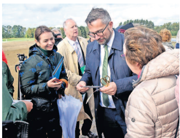
Vor gut 6 Jahren begann das Bauprojekt. Eine Besucherin zeigte Minister Dulig einige Erinnerungsfotos von dem lang ersehnten Baubeginn.

Die Freigabe der Anbindung von Leppersdorf an den neuen Kreisverkehr und die Freigabe der neuen A 4-Anschlussstelle Pulsnitz (Fahrtrichtung Görlitz) erfolgte am Montag, dem 16. Oktober 2023.