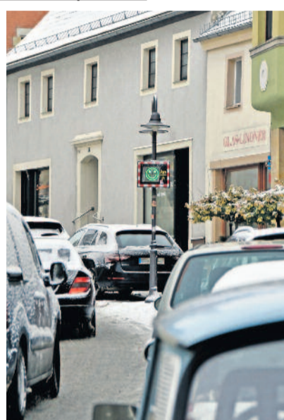
Am 04. Dezember 2023 startete der Verkehrsversuch auf der Hauptstraße. Mit einer Geschwindigkeitsbegrenzung auf 20 km/h sollte die Aufenthaltsqualität aller Verkehrsteilnehmer und Anwohner verbessert werden.

Der erste Versuch, der vom 4. Dezember 2023 bis zum 3. März 2024 stattfand, konzentrierte sich auf die Hauptstraße, den Markt und die Oberstraße. Ziel war es, durch eine Reduzierung der Höchstgeschwindigkeit auf 20 km/h das Queren der Fahrbahn für Fußgänger zu erleichtern und das allgemeine Aufenthaltsgefühl zu verbessern. Angesichts der hohen Geschäftsdichte sowie der Nähe zu Schulen und Kitas ist dieser Bereich besonders verkehrssensitiv.