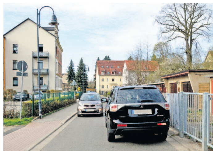
Die beengten Verhältnisse auf der Wasserstraße sind schon lange ein Thema. Vor allem während des Stadtbadbetriebes kommt es immer wieder zu gefährlichen Situationen, weil Autofahrer auf den Gehweg ausweichen müssen oder mit unangepasster Geschwindigkeit fahren.

Die Bürgerbeteiligung zeigte zwar nur eine Unterstützung von 52,7 % für die Einführung einer Einbahnstraße, dennoch belegte die Maßnahme ihre Wirksamkeit. Die Einbahnstraßenregelung wird nun in angepasster Form auf der Wasserstraße umgesetzt, wobei Radverkehr in Gegenrichtung erlaubt sein wird. Mandy Thümer weist darauf hin, dass etliche Anwohnerhinweise zur finalen Modifizierung der Verkehrsregelung beigetragen haben.